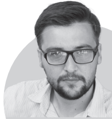
Подготовил Александр ТРУБИН

«ОрёлГУ» выиграл всероссийский турнир «Футзал — в вузы».