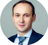
Александр Шевелёв, генеральный директор ПАО «Северсталь»:

— Запуск нового производства металлоконструкций — это стратегический шаг не только для нашей компании, но и для всей строительной отрасли страны. Уникальное оборудование поможет компании «Северсталь Стальные Решения» производить крупногабаритные тяжеловесные металлоконструкции на площадке в Орле, открыть для себя новые рынки сбыта и новых партнёров.