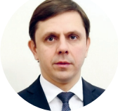
Андрей Клычков, губернатор Орловской области:

— Несмотря на все вызовы, регион продолжает привлекать инвестиции и наращивать производственные мощности. За последние годы в области было открыто более 30 новых промышленных предприятий, включая этот важный индустриальный объект. Здесь будет создано более 300 новых рабочих мест с высокой оплатой труда. Новый комплекс позволит производить 32 тысячи тонн металлоконструкций к 2028 году, что с учётом уже действующих мощностей в три раза увеличит объём производства металлоконструкций на площадке в Орле — до 48 тысяч тонн в год.