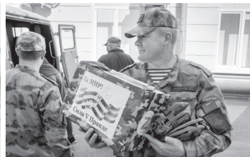
Тыл — фронту

ет помощь фронту в работе, стабильном порядке, — подчеркнул губернатор. —