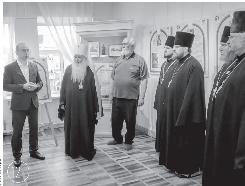
История Орловской земли тесно связана с православием

— Красный цвет — это подвижники благочестия, причисленные к лику святых, которые прославлены, зелёный — это люди, работа по канонизации которых пока что в процессе, — говорит она. — Важно, что кроме биографий и изображений наших святых, фотографий храмов, на каждом стенде есть слова, с кото-