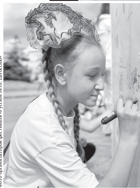
Фото организаторов фестиваля «Русское лето. ЗаРоссию»