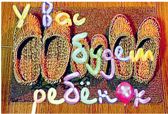
Фото: заставка рубрики «У вас будет ребёнок» // кадр программы «Когда все дома»