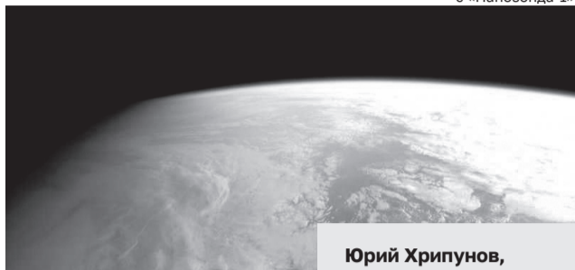
Фото Земли с «Нанозонда-1»