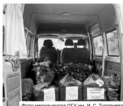
Фото медицентра ОГУ им. И. С. Тургенева

Засищаемым нас от вражеских ракет и беспилотников военнослужащим сотрудники университета передали блиндажные свечи, которые подарят тепло и свет бойцам, маскировочные сети, продукты питания длительного хранения и средства личной гигиены.