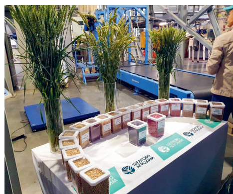
Сортовое изобилие озимой пшеницы