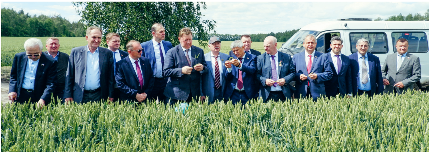
Возле уникального сорта Зюгановка парламентарии Госдумы сделали фото на память

Напомним, Ермоловка дважды внесена в Книгу рекордов России за показатели урожайности, а потенциал этого сорта — более 150 ц/га.