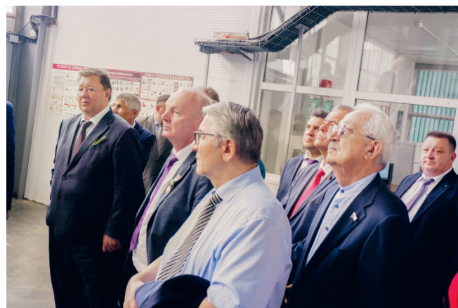
Технология подготовки семян на заводе «Бетагран Семена» вызывает восхищение