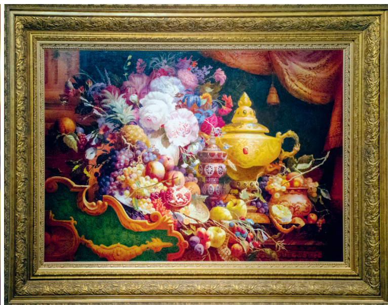
Один из залов галереи отведён под натюрморты