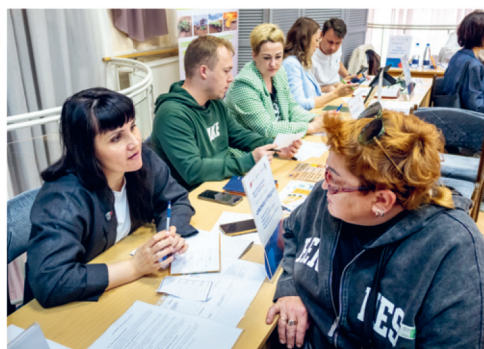
Шанс на работу