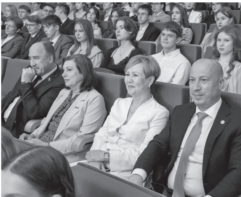
На Орловщине сфере образования уделяется приоритетное внимание

С отличным окончанием школы радостных и нарядных юношей и девушек пришли поздравить губернатор Андрей Клычков и председатель Орлов-