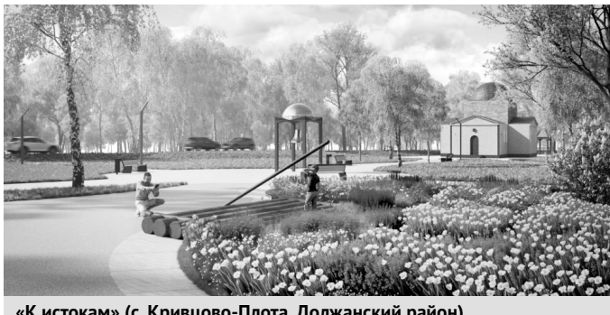
«К истокам» (с. Кривцово-Плота, Должанский район)