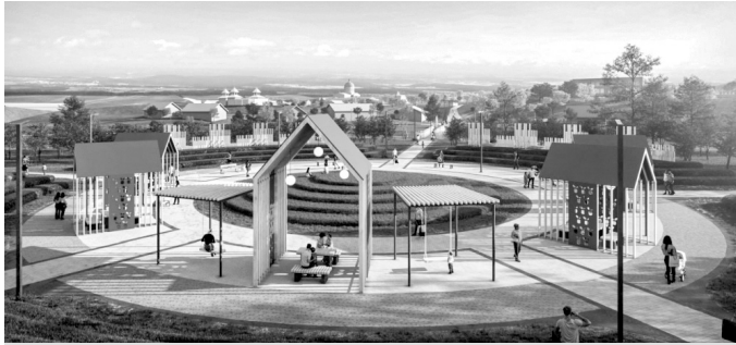
«Лесков Посад» (пгт. Кромы)