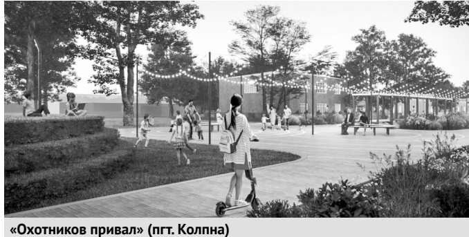
«Охотников привал» (пгт. Колпна)

— Орловская область традиционно добивается высоких результатов во Всероссийском конкурсе лучших проектов создания комфортной городской среды, организованном Минстроем РФ. Общая сумма, которая будет направлена на реализацию проектов, составляет более 290 миллионов рублей.