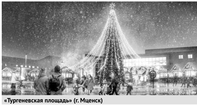
«Тургеневская площадь» (г. Мценск)