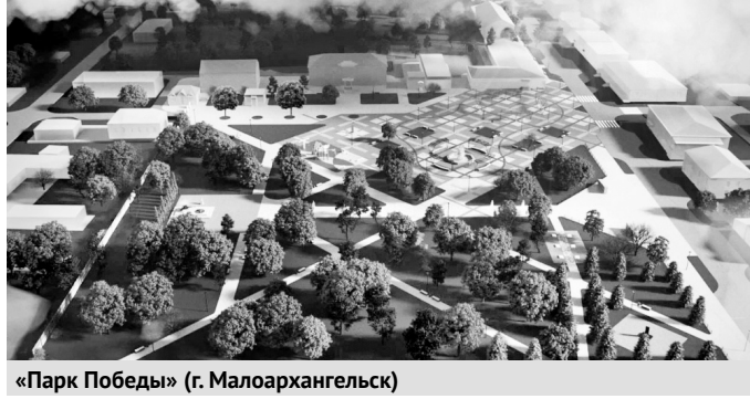
«Парк Победы» (г. Малоархангельск)