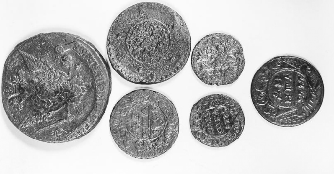
Монеты разных эпох

Доцент кафедры теологии, религиоведения и культурных аспектов национальной безопасности ОГУ им. И. С. Тургенева, кандидат искусствоведения, эксперт-искусствовед