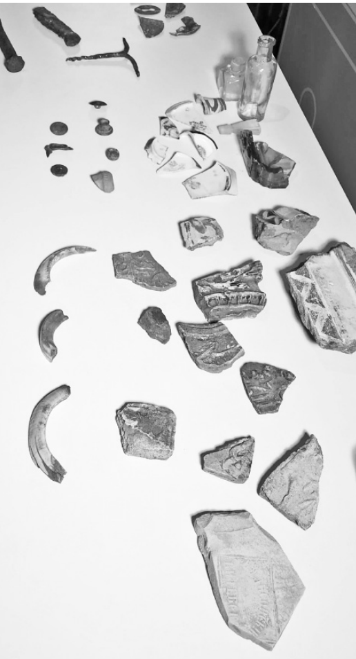
Каждая вещь — свидетель давнего времени

конца XI — начала XII века и свидетельствует о раннем культе чудотворцев Бориса и Глеба — убиенных князей, сыновей Владимира, крестителя Руси. Культ их начина-