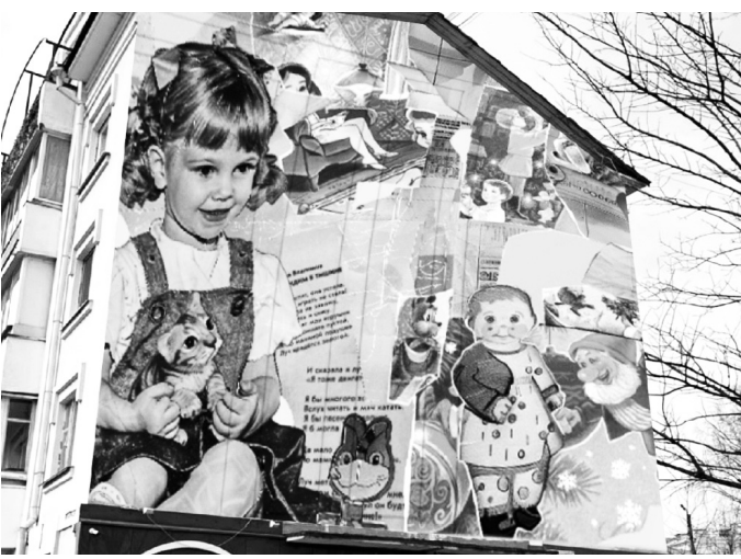
На работу вдохновили стихи Елены Благиной