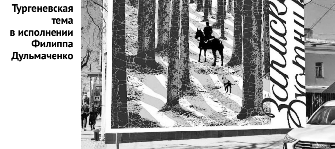
Тургеневская тема в исполнении Филиппа Думльмаченко