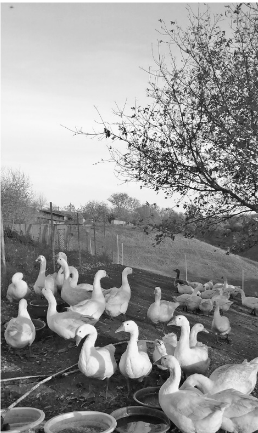
На подворье гусям раздолье