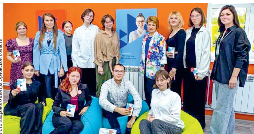
Молодые, энергичные, уверенные...