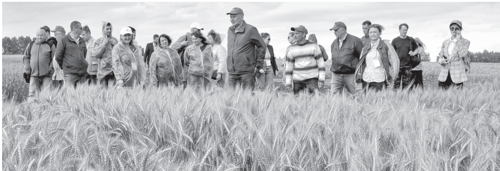
Абсолютное большинство докладов и сообщений на конференции носили прикладной характер