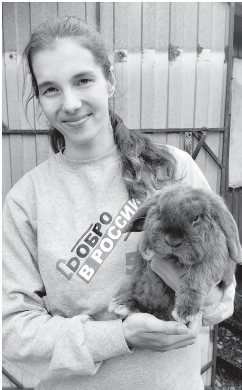
Обязательно и общительному минилопу Батону требуются внимание, забота и ласка