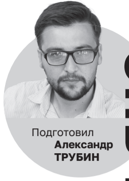
Подготовил Александр ТРУБИН