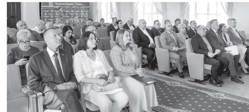
Муниципальная реформа позволит эффективнее решать вопросы местного значения

щих принципах организации местного самоуправления в единой системе публичной власти» было посвящено заседание правления ассоциации «Совет муниципальных образований Орловской области», которое прошло в Ливнах 9 сентября.