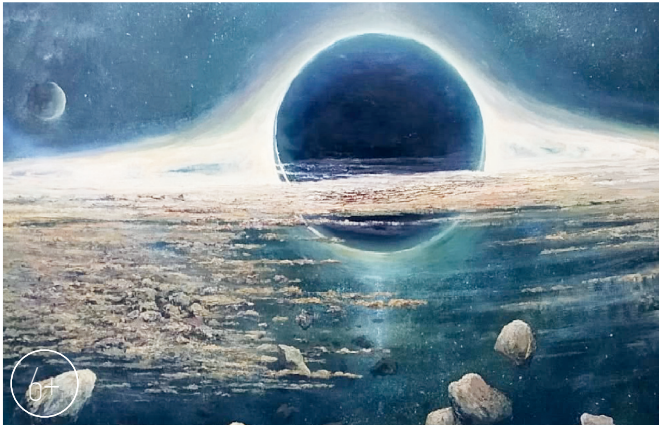
Вечная тайна чёрной дыры

ет, но в целом удалось запечатлеть общий колорит, а над деталями работал уже дома, — вспоминает он.