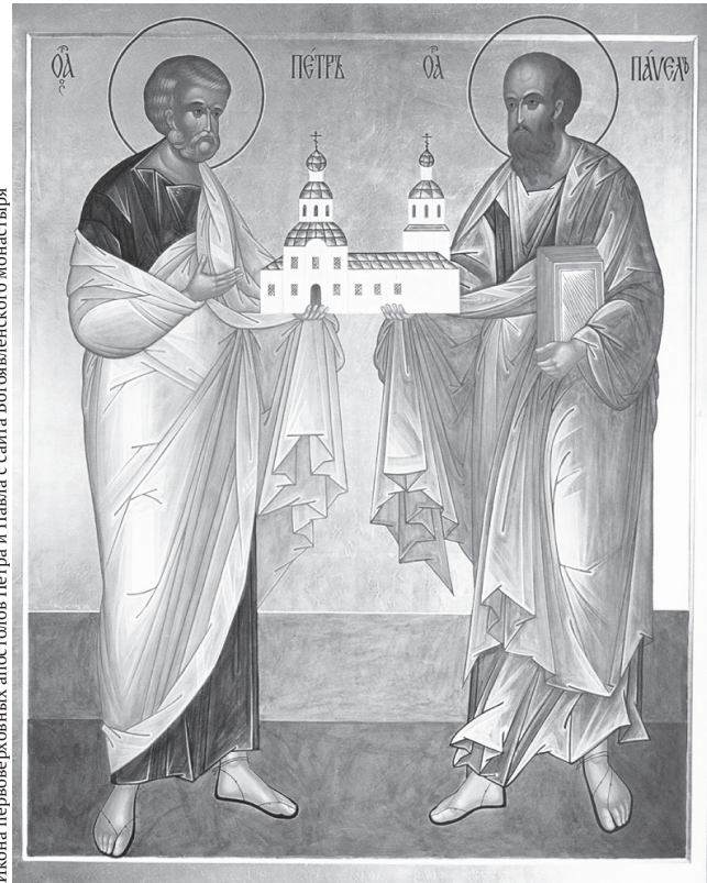
Икона первоверховных апостолов Петра и Павла

12 июля — праздник первоверховных апостолов Петра и Павла