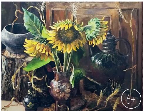
Натюрморт с подсол- нухами

извещает граждан о проведении работ по химической обработке сельскохозяйственных культур на полях, в радиусе 7 км от которых расположены следующие населённые пункты: с. Козьминка, с. Грязцы, п. Тихий Уголок, д. Хмелевая, п. Совхозный, д. Каменево, д. Жилево, д. Липовец, п. Комсомольский, д. Сторожевая, д. Прилепы, п. Березово-Воротынский, д. Соловьевка, д. Малахово, д. Будиловка, д. Новинка, с. Остров, с. Успенское, с. Кунач, д. Викторовка, д. Алдобаевка, д. Луги Апушкины, д. Хвощевка, с. Мезенцево, с. Свободная Дубрава, с. Воротынский, с. Лютее, д. Гремячий Колодезь, д. Овсянниково, д. Орлово, д. Пешково-Гремяченские Выселки, д. Пешково, г. Ливны,