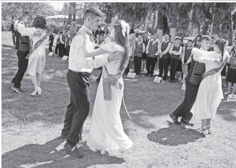
Мы расстанемся, чтоб встретиться вновь