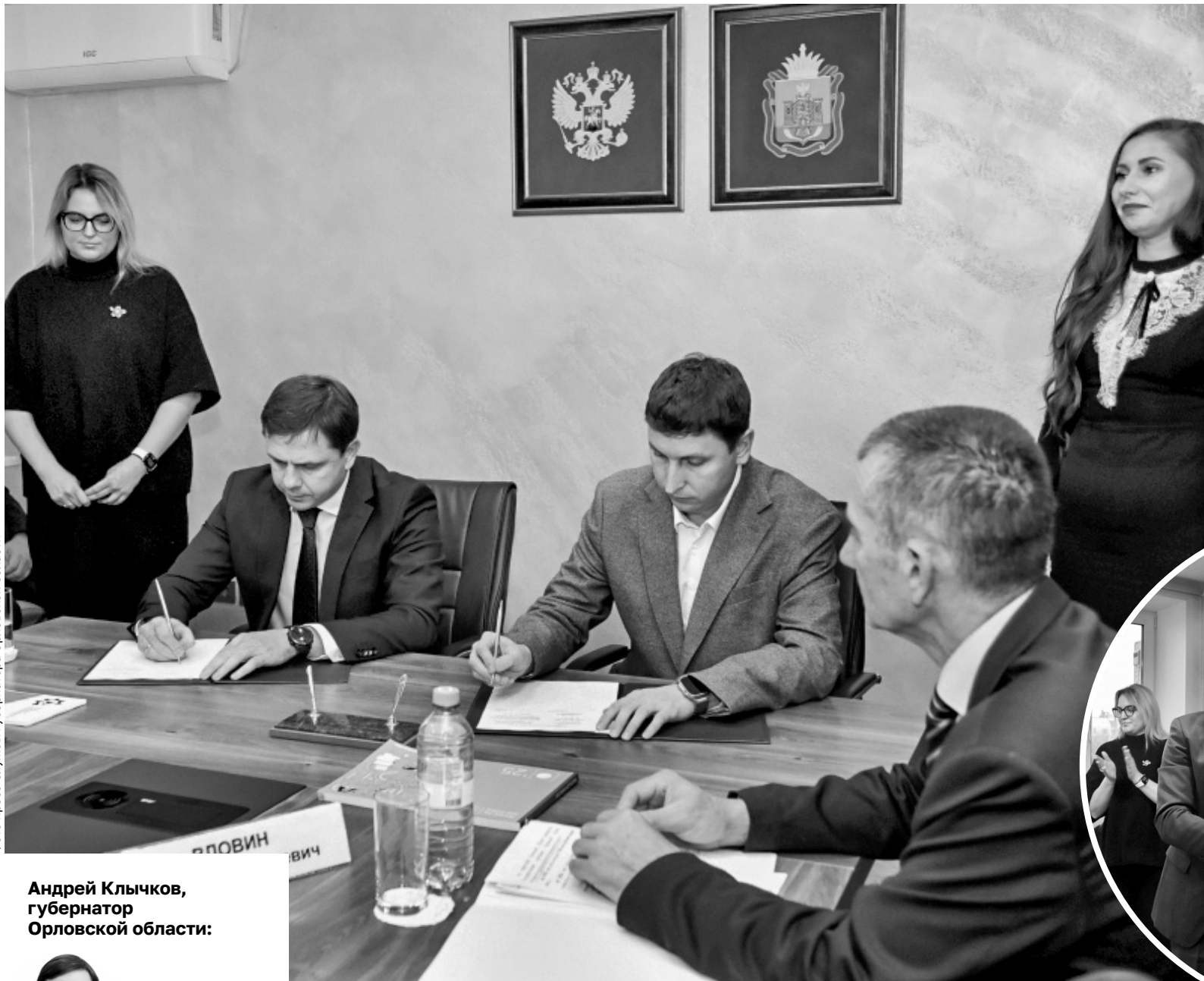
Андрей Клычков, губернатор Орловской области: