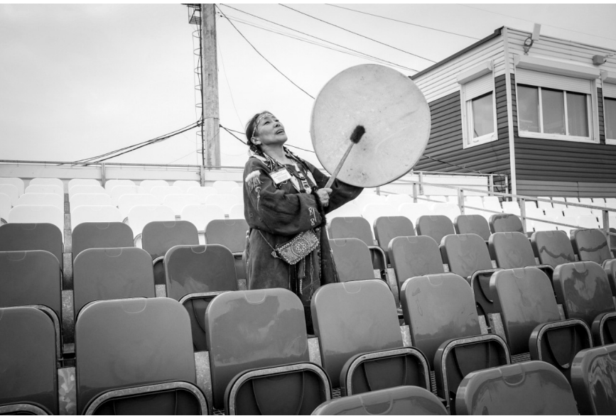
У Севера особая природа и особые люди

метили, что она атмосферная. Кроме того, что ощущался приглушённый синий цвет холода — холодного неба и снега, казалось, что во всех работах также приглушён и свет, и от этого чувствовалась нотка грусти. Во всём — в показанных крупным планом натруженных руках, ски-