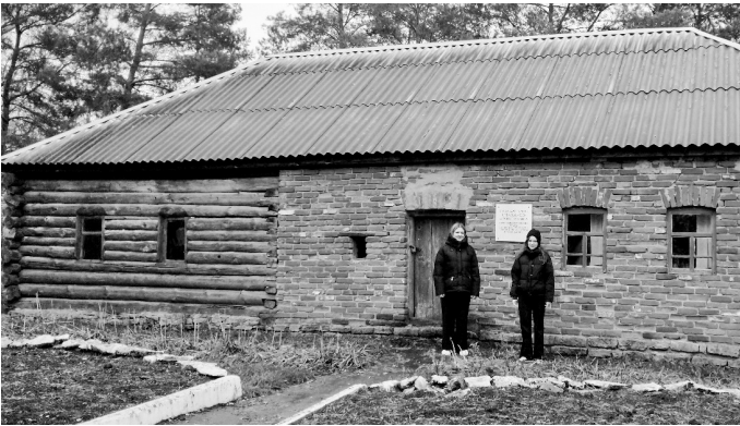
Дом, где родился А. Г. Стаханов

приехал в Измалково. На ми-тинге, встреченный горячи-ми, долго не смокаящими аплодисментами, с краткой речью выступил Алексей Гри-горьевич, потом отправился с женой в родное село Луго-вое — в колхоз «Красная Зве-зда». В колхозе шла молотба. Стаханов заметил, что в его присутствии на молотил-ке обмолачивают 150 копен в день, а в его отсутствие — только по 100».