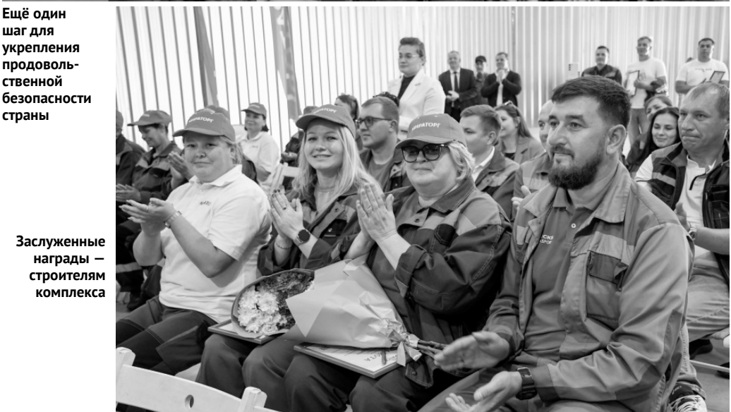
Ещё один шаг для укрепления продовольственной безопасности страны