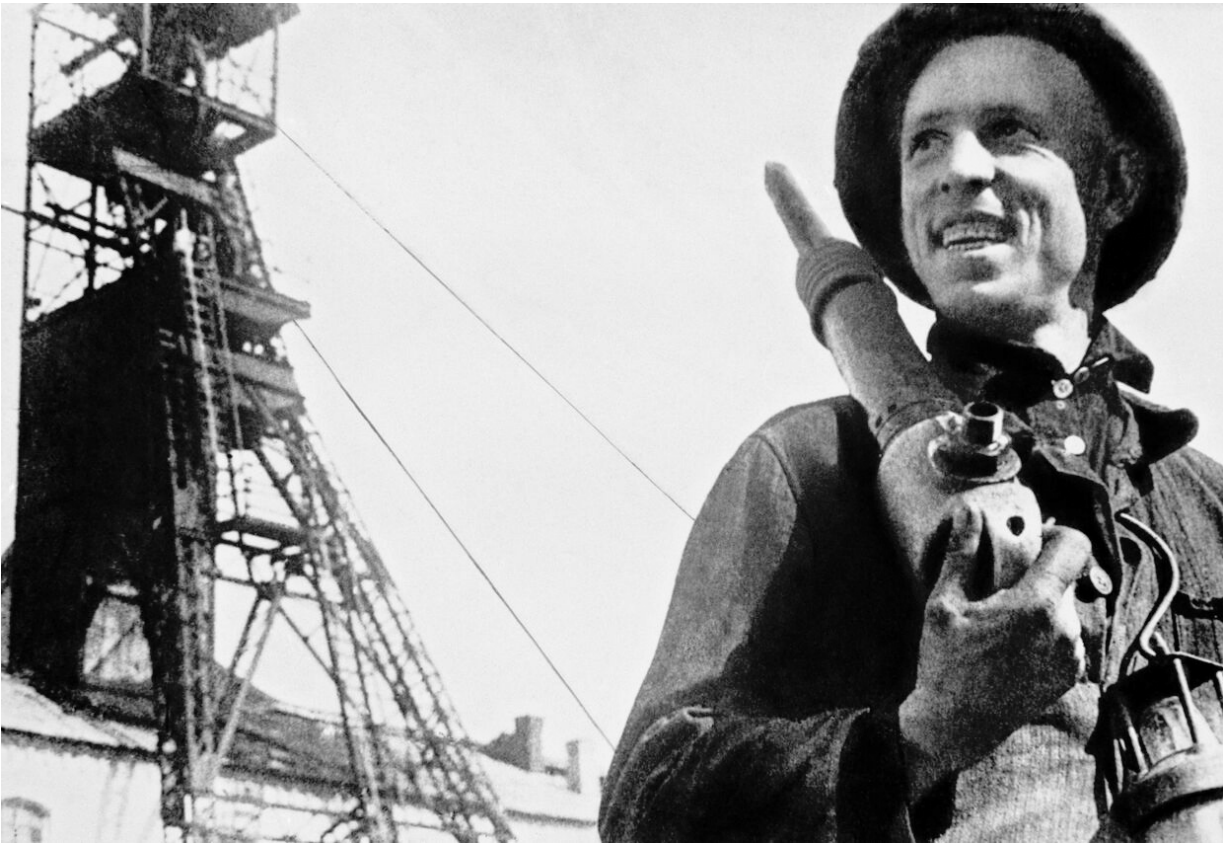
Алексей Григорьевич Стаханов после установления рекорда