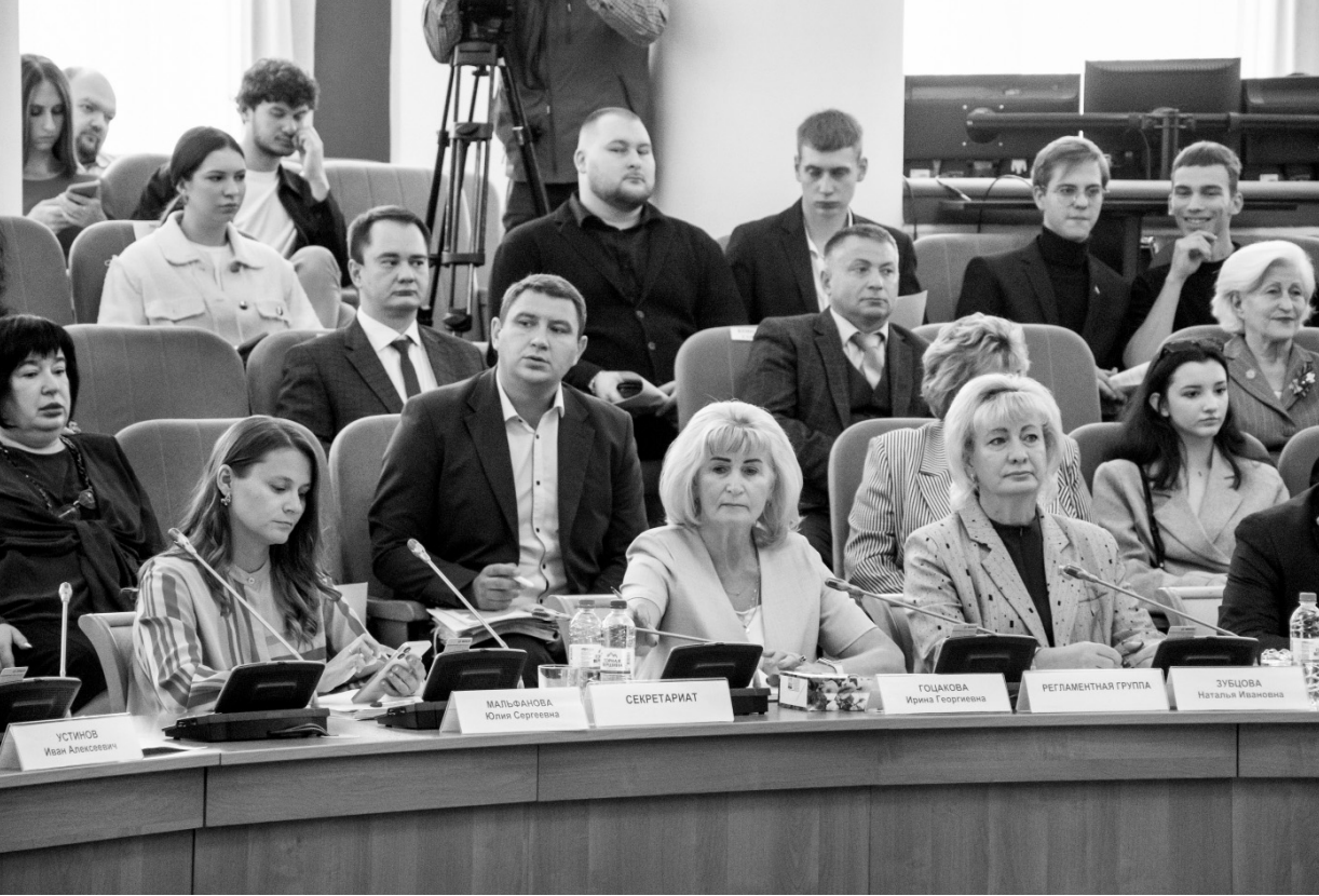
Депутаты областного Совета направят три обращения по актуальным вопросам в Правительство РФ и Госдуму ФС РФ

черкнул важность выделения дополнительных средств на поддержку участников СВО и их семей. Парламентарии приняли предложенный законопроект сразу в двух чтениях. Против его принятия проголосовали лишь депутаты фракции «Справедливая Россия — За правду».