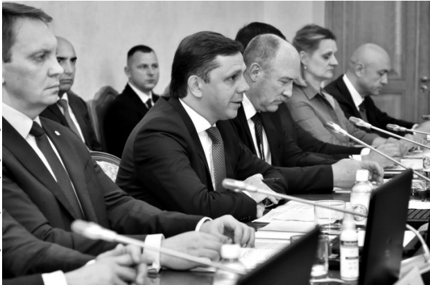
Орёл и Брест стали городами-побратимами.