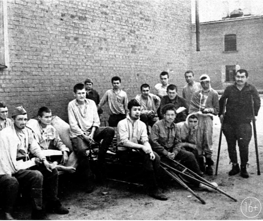
Советские военнопленные, освобожденные частями Красной Армии. Орёл, 5 августа 1943 г.

Сохранившиеся в архиве списки советских военнопленных, помимо имён, отчества и фамилий, содержат сведения о дате рождения, домашнем адресе, национальности, ранениях, заболеваниях, времени поступления в лагерь и выбытии (смерти). Эта информация позволяет проводить идентификацию лиц, пропавших без вести в годы войны,