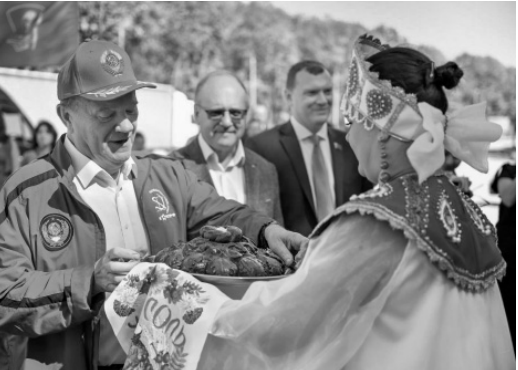
Земляка Геннадия Зюганова на Орловщине встретили хлебом-солью