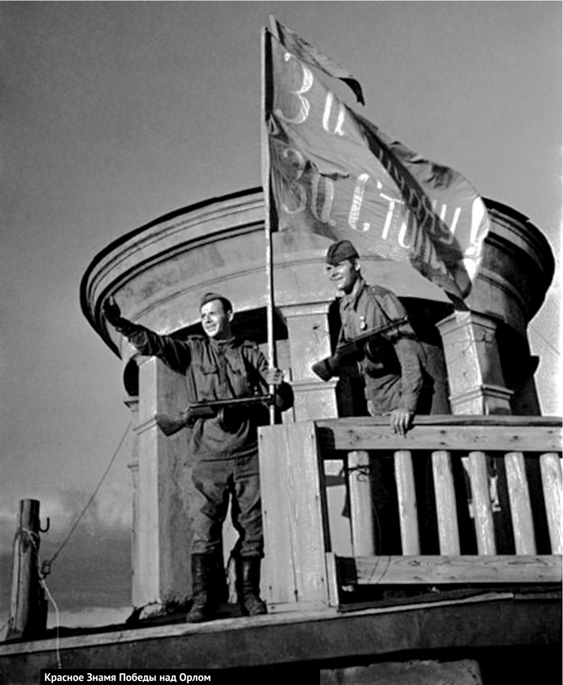
Красное Знамя Победы над Орлом