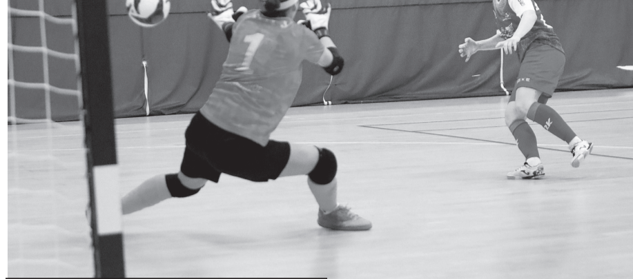
ФУТЗАЛ. ЖЕНЩИНЫ. ФУТЗАЛ — В ВУЗЫ

Орловчанки вышли в полуфинал всероссийского проекта «Футзал — в вузы».