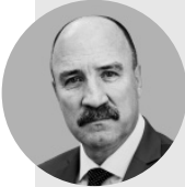
Леонид Музалевский, председатель Орловского областного Совета народных депутатов:

— Появление Следственного комитета Российской Федерации — важный шаг в становлении современной правоохранительной системы. Сотрудники регионального управления с честью выполняют возложенные на них обязанности. Ведомство вносит колоссальный вклад в укрепление государственности и борьбу с криминалом. Региональное управление обеспечивает необходимые условия для развития Орловщины, сохранения социальной стабильности, консолидации общества. Деятельность следователя — это особая ответственность перед государством, законом и людьми. Благодарю вас за конструктивное взаимодействие, вклад в борьбу с преступностью и в развитие региона!