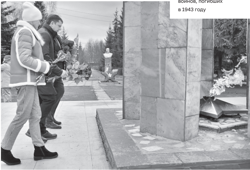
В рамках рабочей поездки в Урицкий район Андрей Клычков возложил цветы к братской могиле советских воинов, погибших в 1943 году

ская база на сумму более 787 тыс. рублей.