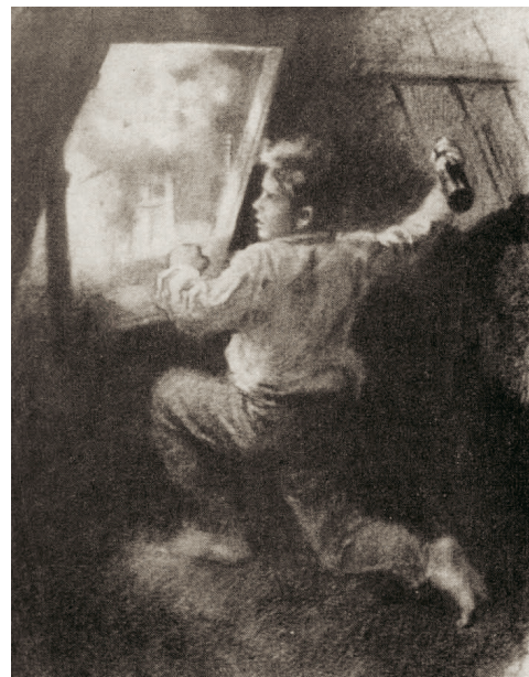
Серёжа Тюленин поджигает немецкий штаб. Иллюстрация к роману Александра Фадеева «Молодая гвардия»

Начальник краснодонского жандармского поста Отто Шен показывал на следствии: «Тюленин держал себя на допросе с достоинством, и мы удивля-