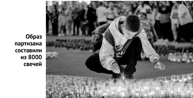
Образ партизана составили из 8000 свечей

У стены Памяти на площадке перед МФЦ в рамках проекта «Историческая память» представители молодёжных организаций из восьми тысяч свечей выложили образ партизана.