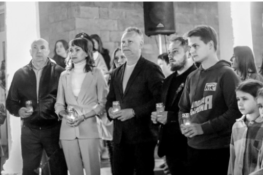
Память героев почтили минутой молчания

Ровно в 4 часа утра у подножия стелы «Орёл — город воинской славы» собравшиеся зажгли