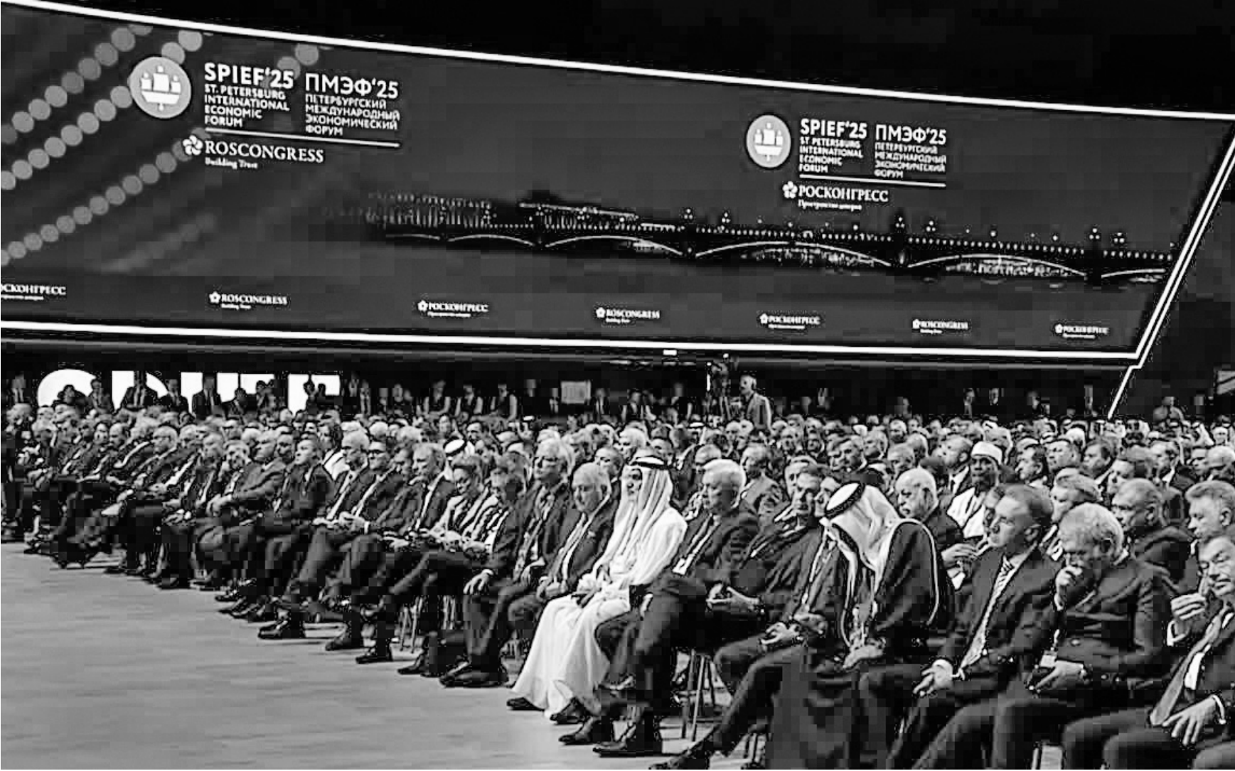
За пленарным заседанием ПМЭФ-2025 следили во всём мире