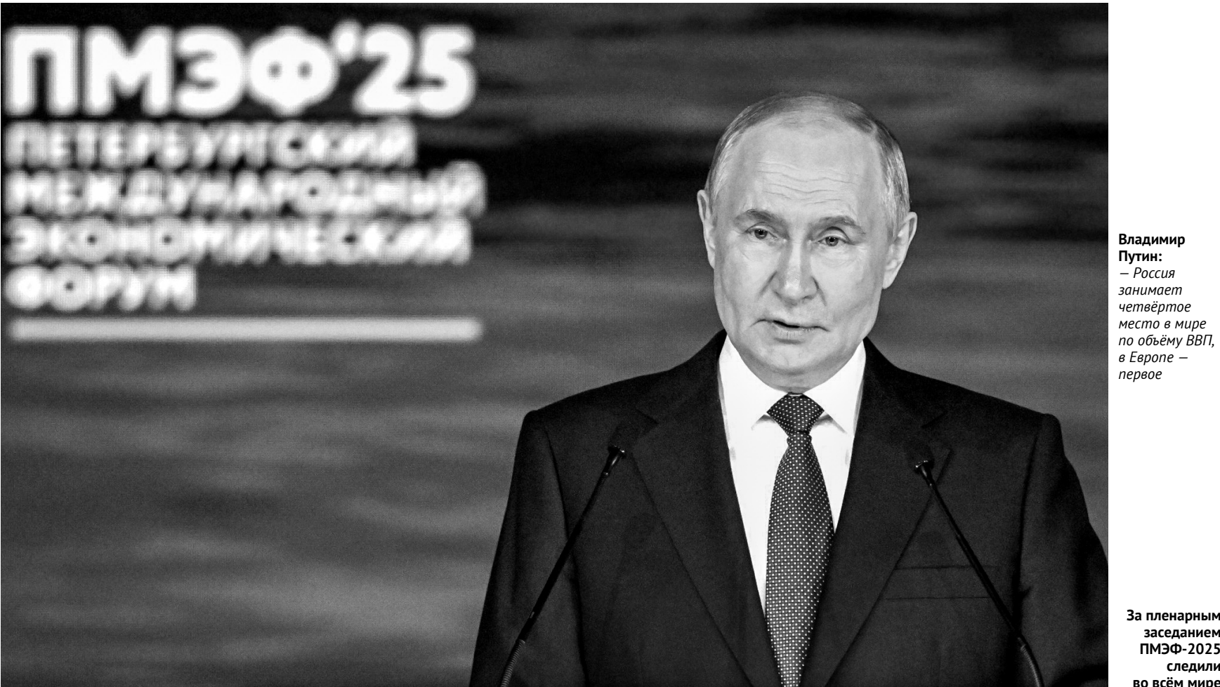
Владимир Путин: — Россия занимает четвёртое место в мире по объёму ВВП, в Европе — первое