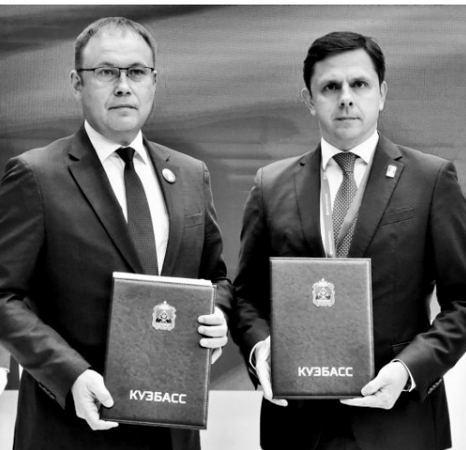
Орловщина и Кузбасс — хорошие друзья и партнёры

Сотрудничество Орловщины с регионами Беларуси набирает обороты