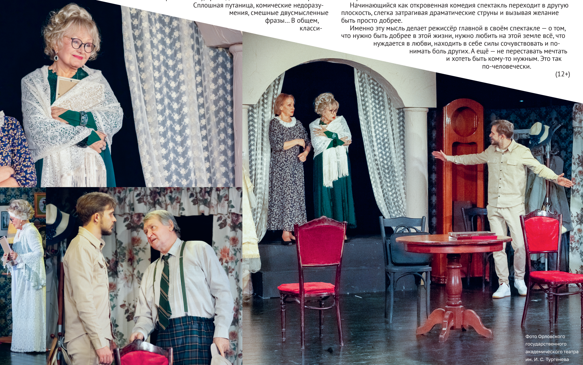
Фото Орловского государственного академического театра им. И. С. Тургенева