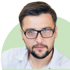
Страницу подготовил Александр ТРУБИН

12 декабря. Крылатые барсы — ОрёлГУ. Стальные сердца — ТИУ. 13 декабря. ТИУ — Крылатые барсы. ОрёлГУ — Стальные сердца. (0+)