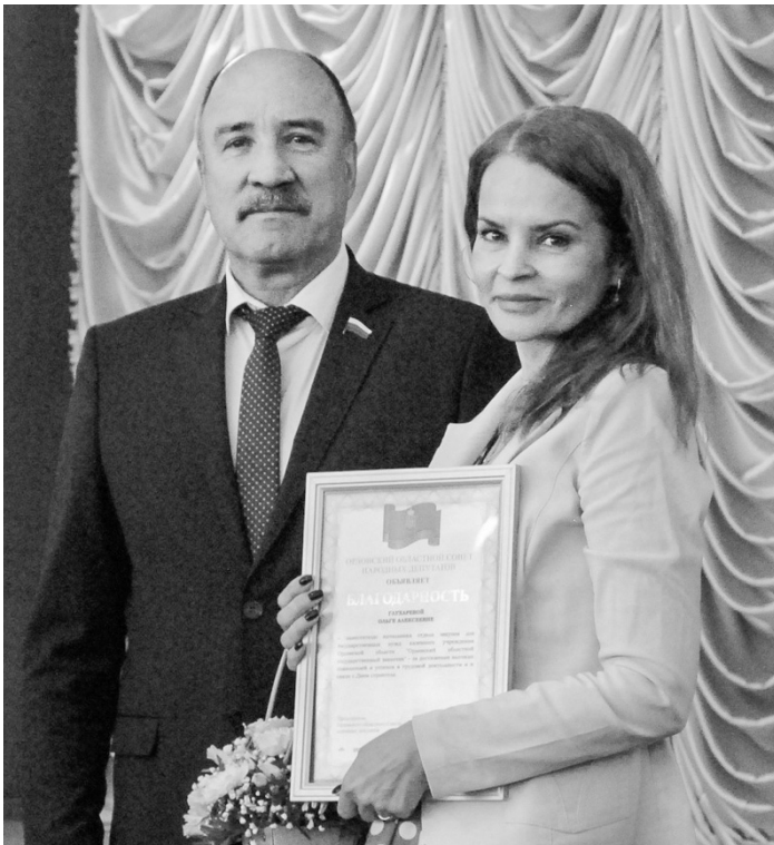
По заслугам — и почёт!