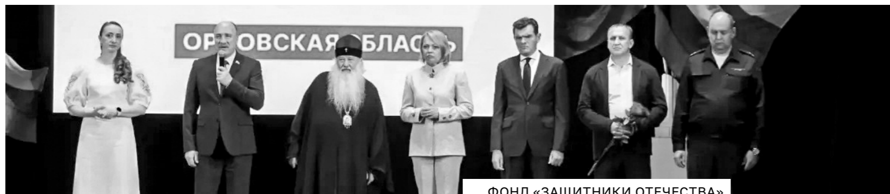
ФОНД «ЗАЩИТНИКИ ОТЕЧЕСТВА»