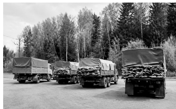
Фото медицентра ОГУ им. И. С. Тургенева

— Пока есть необходимость, координаторы и волонтеры будут продолжать напряжённую работу по обеспечению наших защитников всем необходимым, невзирая на расстояния и логистические сложности, — уверены в ОГУ им. И. С. Тургенева. — Уже через две недели планируется отправка следующей партии помощи в зону боевых действий.