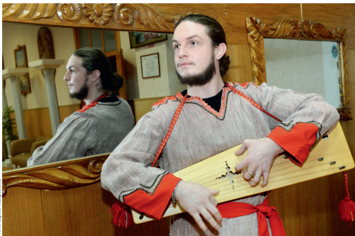
Струны гуслей — как проводник из прошлого в вечное