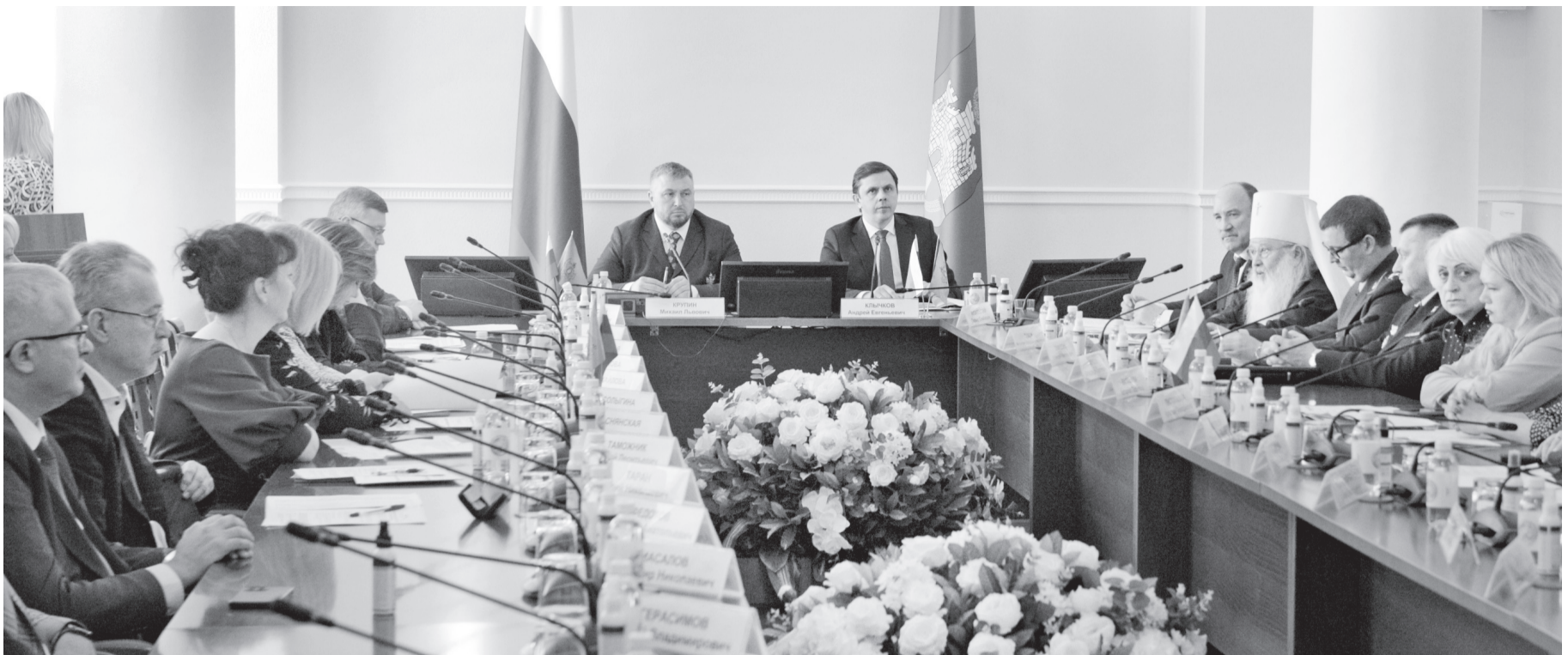
Семейные ценности нуждаются в защите государства и общества