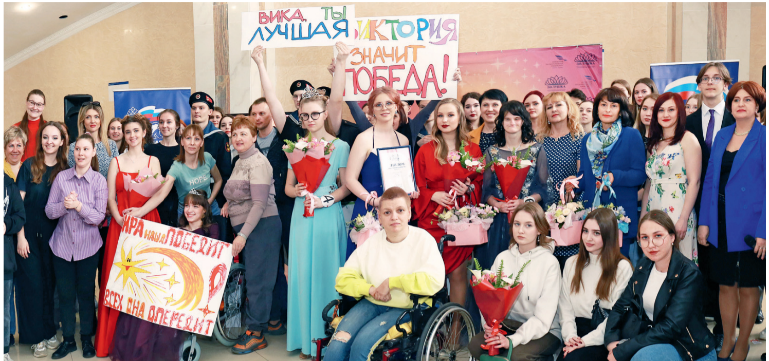
Они — лучшие!