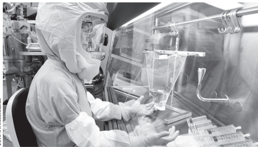
Мир должен осмыслить реальную опасность, рождающуюся в тайных биологических лабораториях США

удар, спасая народ Донбасса и других русскоговорящих территорий от истребления бандеро-фашистскими бандами, наша страна вынуждена была начать специальную военную операцию.