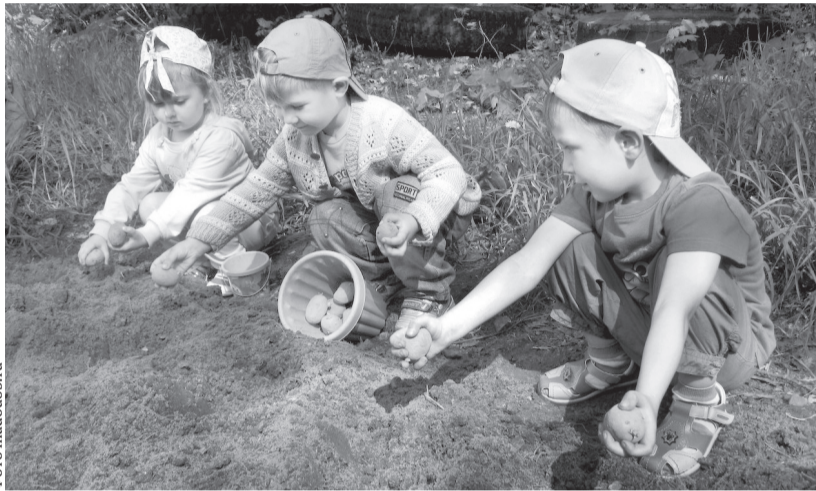
Тот не знает наслаждения, кто картошку не сажал

Главная причина популярности цветного картофеля — в его составе. В нём очень много антоцианов — именно они отвечают за яркую окраску мя-