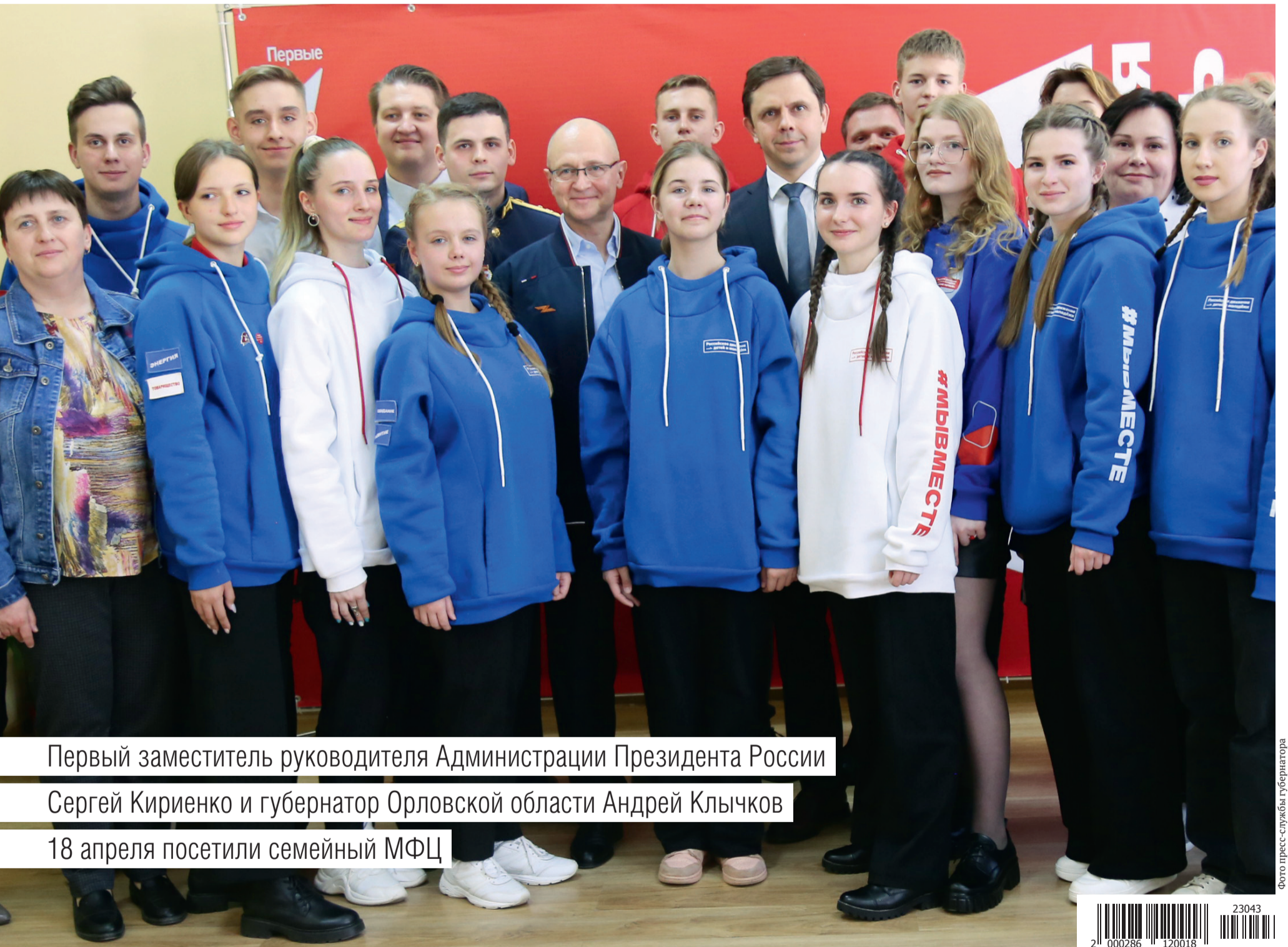
Первый заместитель руководителя Администрации Президента России Сергей Кириенко и губернатор Орловской области Андрей Клычков 18 апреля посетили семейный МФЦ