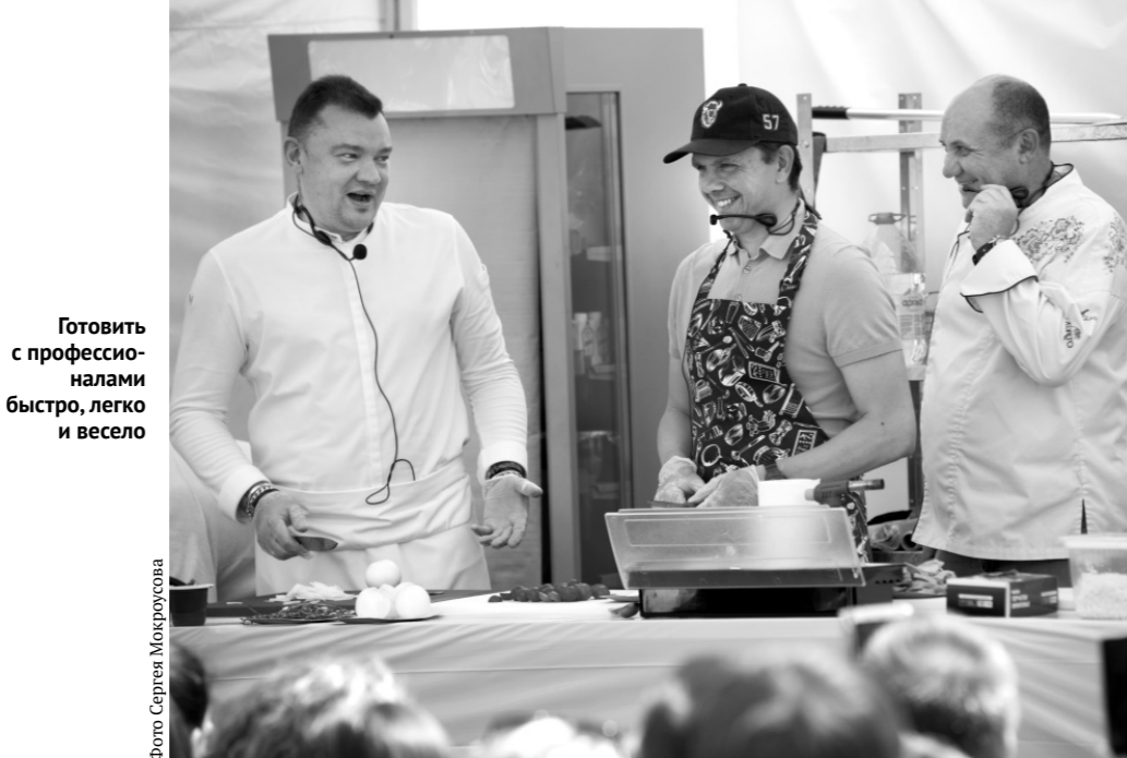
Готовить с профессионалами быстро, легко и весело