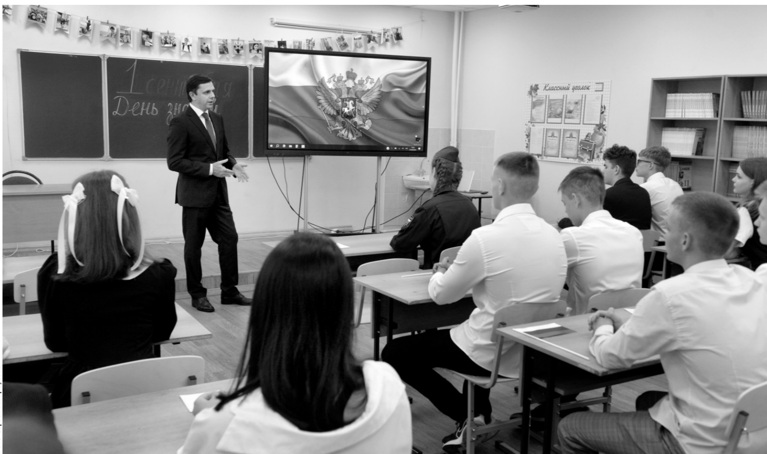
Андрей Клычков провёл открытый урок «Разговор о важном» для учеников лицея № 40 г. Орла

— Перед нашей страной стоят важнейшие задачи защиты национальных интересов, обеспечения технологического и духовного суверенитета, — подчеркнул губернатор, отметив активную патриотическую позицию сту-