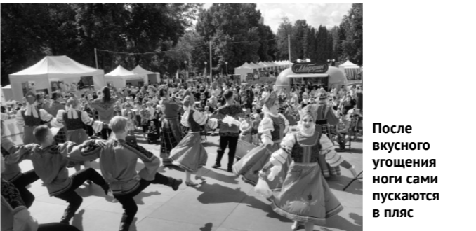
После вкусного угощения ноги сами пускаются в пляс

евны Толстой. О котлетах по-лужицки мы узнали, изучая биографию Ивана Сергеевича Тургенева, — это было одно из любимых его блюд.