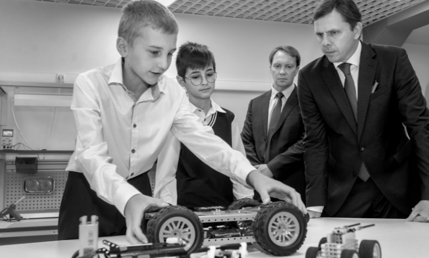
Будущие инженеры и конструкторы с увлечением занимаются в «Кванториуме»