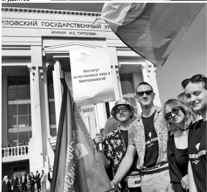
В ОГУ им. И. С. Тургенева учатся более 17 тысяч студентов