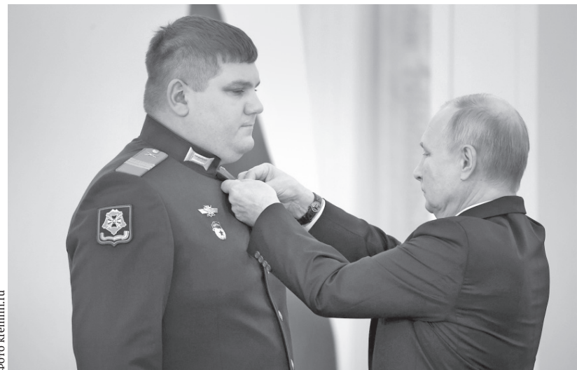
Владимир Путин вручил медаль «Золотая Звезда» Герою России сержанту Юрию Мизерному

— Сегодня под сводами Георгиевского зала Кремля, который олицетворяет величие воинской, ратной славы России, мы чувствуем героев нашего Отечества, людей, чьи выдающиеся дела, свершения и поступки навсегда будут вписаны в историю нашего государства, нашей родной страны, — сказал Президент России Владимир Путин перед церемонией награждения. — Время не властно над памятью народа. Из поколения в поколение передаются чувства благодарности и преклонения перед героями, перед мужеством тех, кто в разные времена и эпохи на полях сражений защищал свободу и независимость Отечества, перед трудом и талантом великих учёных, первооткрывателей, управленцев, деятелей культуры, умножавших славу России. Наш долг — знать и чтить героев,