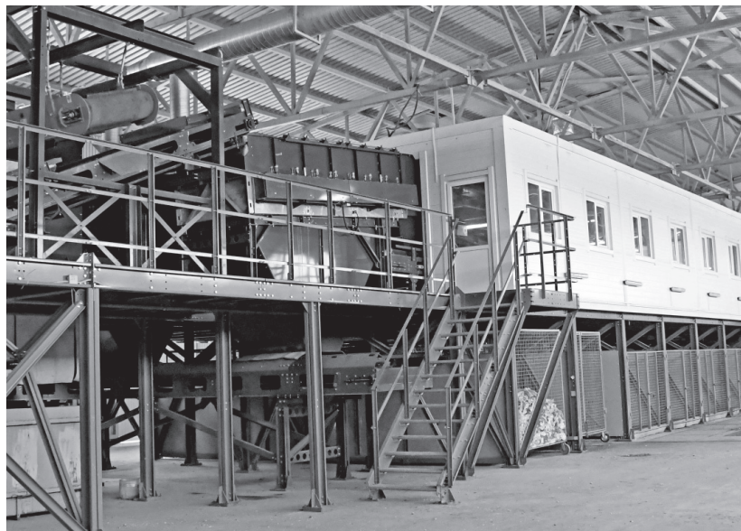
В цехе сортировки мусора

— Основная стройка была завершена несколько лет назад, — поясняет он. — Получены все необходимые разрешения и допуски, полностью готовы приступить к работе. В состав предприятия входят мусоро-сортировочный комплекс, весовая, гараж, административно-бытовой комплекс, станция пожаротушения, полигон, накопительные пруды для грязных и чистых вод, фильтрационная станция. Грязная вода очищается и снова поступает в оборот для технических нужд.