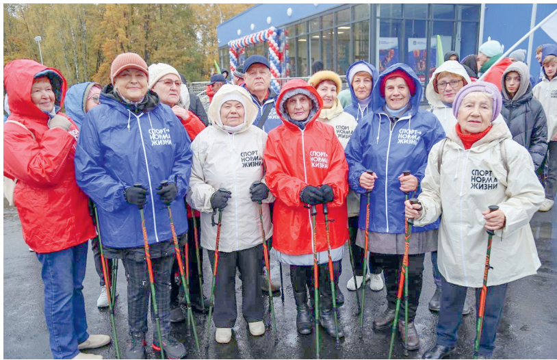
На Орловщине спортом и физкультурой занимаются от мала до велика

Об этом во время обсуждения вопроса реализации проекта «Спорт — норма жизни» национального проекта «Демография» сообщили 11 декабря на аппаратном совещании в администрации региона.