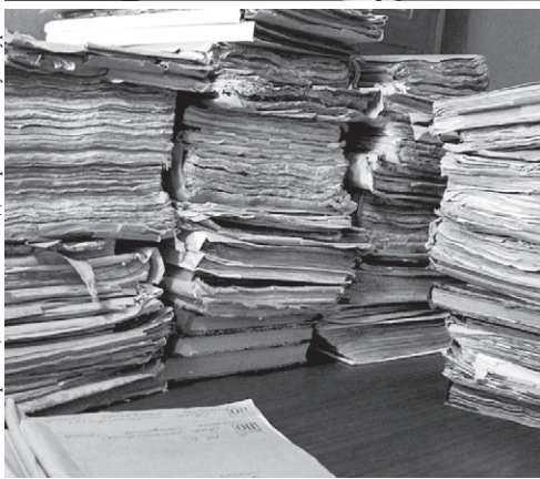
Магия старинных документов

но расширяется электронный научно-справочный аппарат: на сайте архива размещаются базы данных, указатели, путеводители, электронные описи. Собственными силами сотрудники архива постепенно оцифровывают документы. В первую очередь эта работа прово-