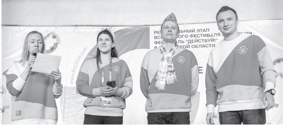
Орловские волонтеры рассказали о своей работе на Всемирном фестивале молодёжи в Сочи

В Орле стартовал региональный этап Всемирного фестиваля молодёжи — фестиваль «Действуй!»