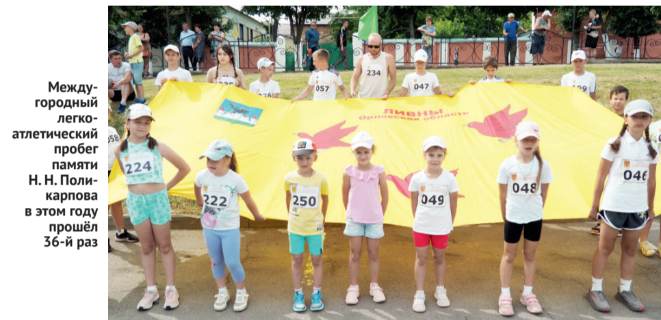
Междугородный легкоатлетический пробег памяти Н. Н. Поликарпова в этом году прошёл 36-й раз