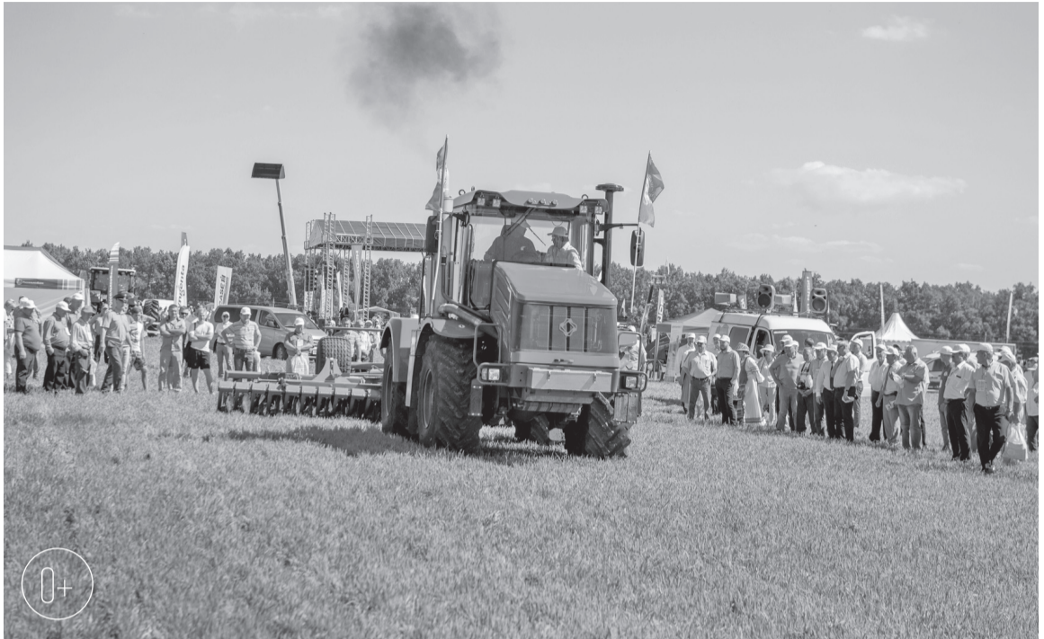
Посетители Дня поля увидят работу отечественной техники

— День поля Орловской области — масштабная площадка для отраслевого диалога с возможностью представить свой