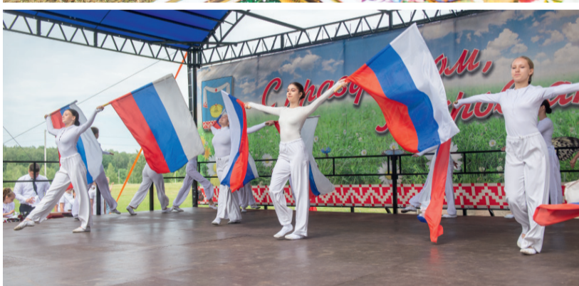
На Покровской земле гостям всегда рады