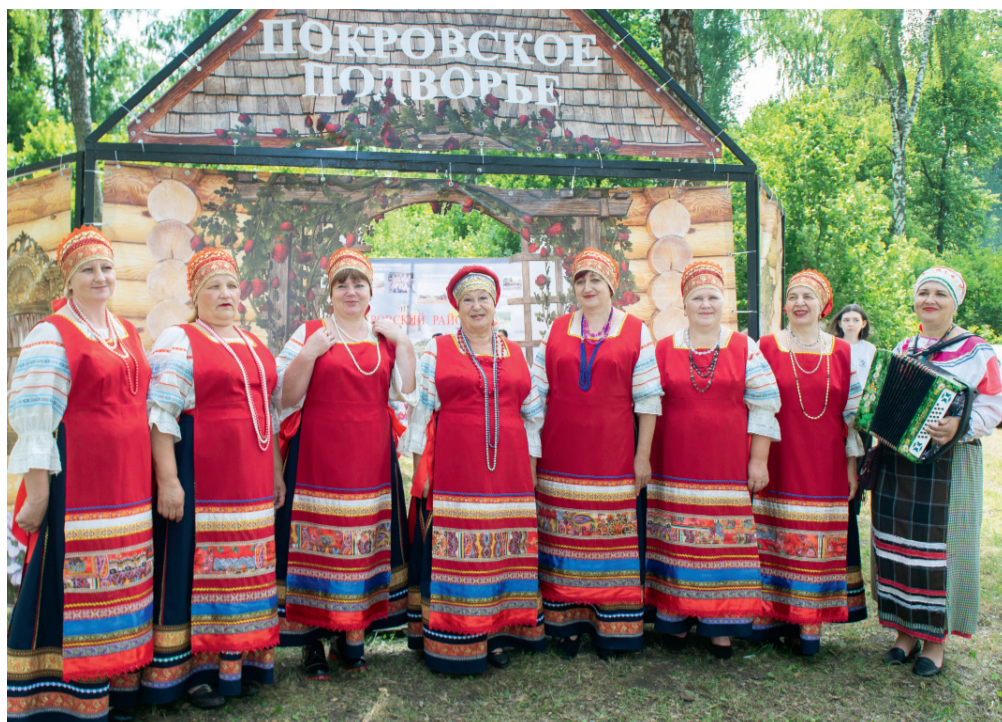
Покровские таланты известны на всю Орловщину