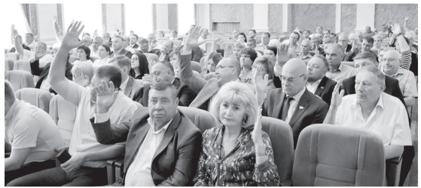
Сейчас не время для политических разногласий

Одним из основных аргументов в пользу действующего губернатора для орловских единороссов стала поддержка, которая была выражена Андрею Клычкову в ходе встречи с Президентом России Владимиром Путиным в Кремле.