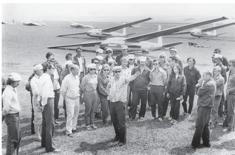
Аэродром Пугачёвка, 1978 год. Предполётные указания на соревнованиях