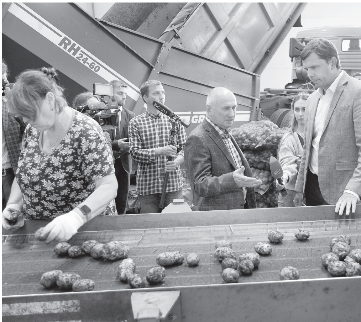
Орловщина — аграрный край

В Орловской области на развитие АПК в 2023 году выделили почти 2,2 млрд. рублей.