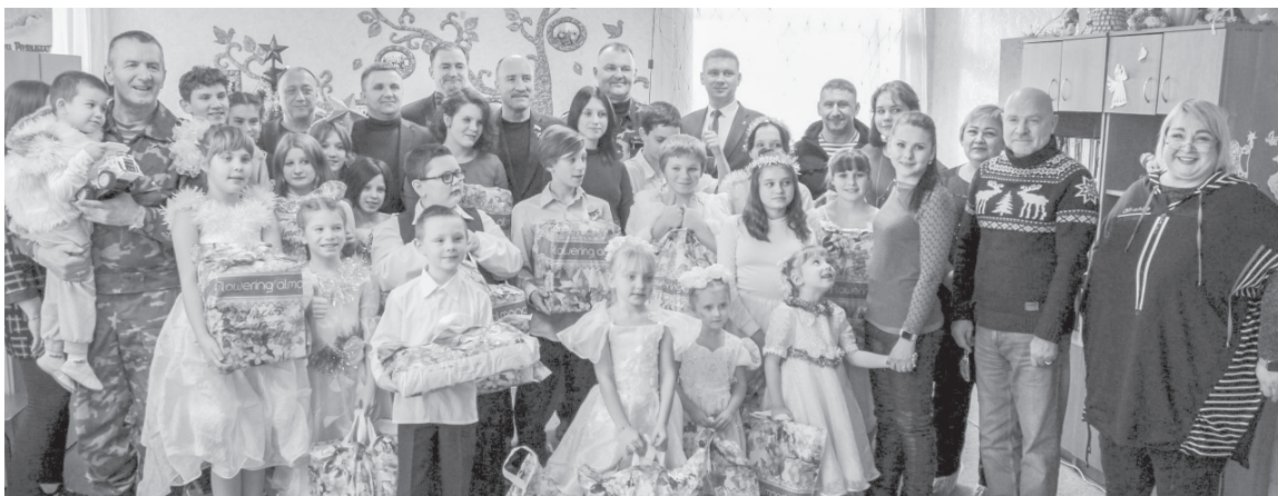
Счастливого Нового года! Орловские депутаты приехали в гости к воспитанникам Луганского детского дома с добрыми пожеланиями и подарками

Пусть новый 2024 год станет счастливым для всех нас! Крепкого здоровья, сил, добра, спокойствия и благополучия. Пусть сбудутся все наши светлые надежды!