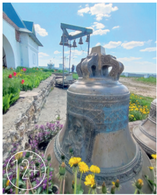
Новосильский район, село Задушное. Свято-Духов монастырь

Экспонируются также уникальные фотоальбомы. Большое внимание уделено книгам и фотоальбомам, посвящен-