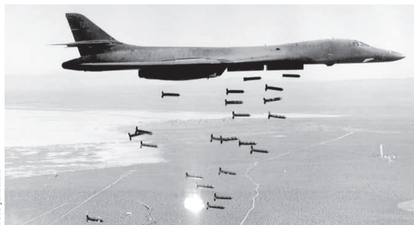
У вэсэушников опытные инструкторы: так американские бомбардировщики сеяли тонны смертельных кассет во время войны в Ираке

Впрочем, удивляться здесь нечему. На допросах попавшие в плен боевики ВСУ хором при-