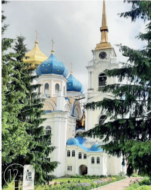
Болхов. Спасо-Преображенский собор