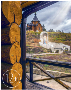
Верховский район, село Корсунь. Живоносный источник