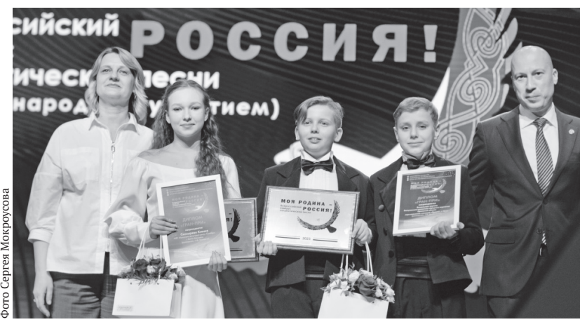
Момент вручения Гран-при

24 апреля в концертном зале Орловского государственного института культуры состоялся гала-концерт Всероссийского конкурса патриотической песни «Моя Родина – Россия!», инициированного кафедрой режиссуры, мастерства актёра и экранных искусств ОГИК.