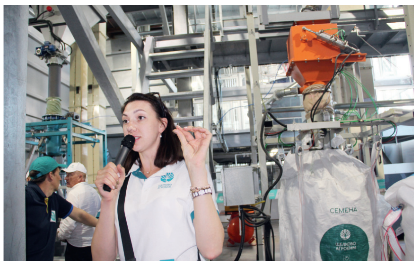
Всё начинается с семян

соеи Бинго собственной селекции компании доходила в Орловской области до 35,6 ц/га, показатель протеина — на уровне 38—43,8 %. На госиспытания переданы ещё три сорта с продуктивностью до 50 ц/га и выше при интенсивной технологии возделывания и с высоким содержанием протеина — более 40 %.