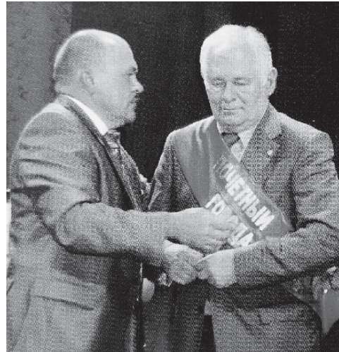
Почётный гражданин г. Ливны Л. М. Рошаль на торжественной церемонии «Лица года» в Ливнах. 2009 г.

Неправильно думать, что все его интересы замыкаются только на медицине. Рошаль любит музыку, балет. Среди его друзей много артистов. Когда есть время он,