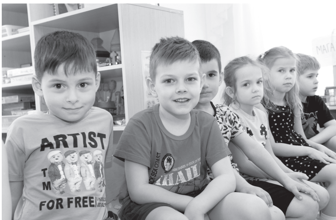
Каждый день для детей полон открытий!

Да, гаджеты дети осваивают быстро, но с точки зрения возраста они всё равно остаются детьми. Олеся до мельчайших де-