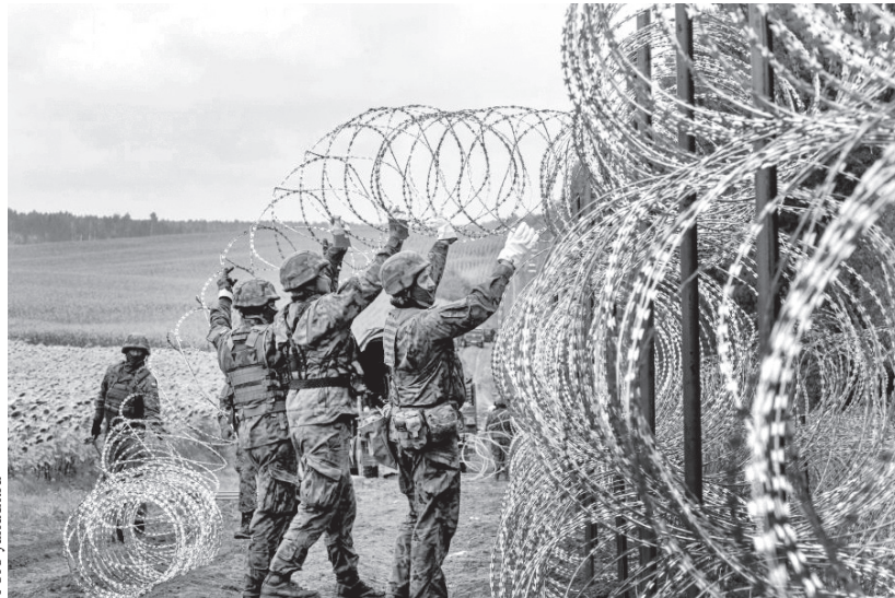
У польского страха глаза велики и колючка до неба

Колючкой планируется «украсить» 200-километровую границу с Калининградской областью. На реализацию этой гигантской и нелепой затеи понадобится около 800 километров стальной проволоки, несколько тысяч тонн бетонных заграждений, пять тысяч видеокамер и десять тысяч датчиков движения.