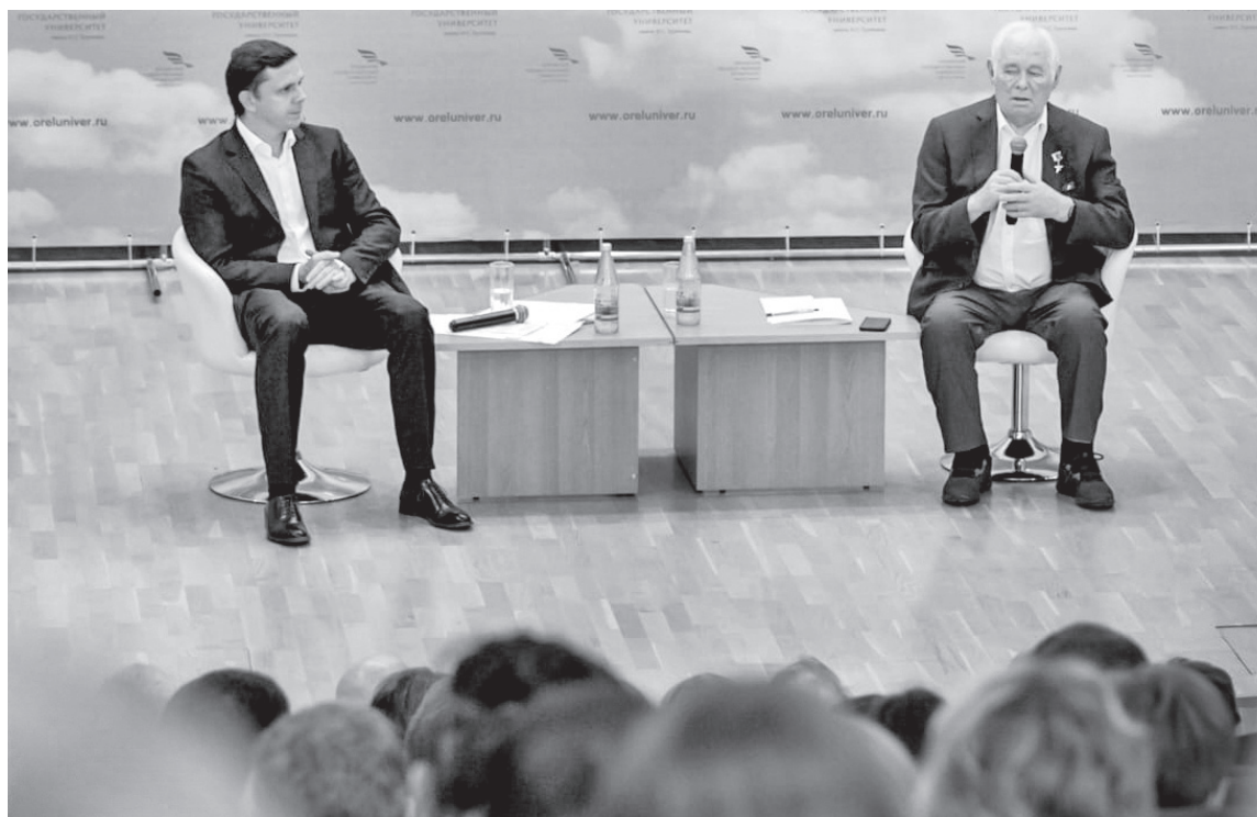
Губернатор Андрей Клычков и Леонид Рошаль на встрече со студентами ОГУ им. И. С. Тургенева. 2022 г.

Я понимал, чем может всё кончиться, но иного выбора не было».