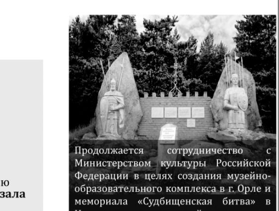
Продолжается сотрудничество с Министерством культуры Российской Федерации в целях создания музейно-образовательного комплекса в г. Орле и мемориала «Судбищенская битва» в Новодеревеньковском районе

Реализовано мероприятие по созданию второго виртуального концертного зала в г. Ливны