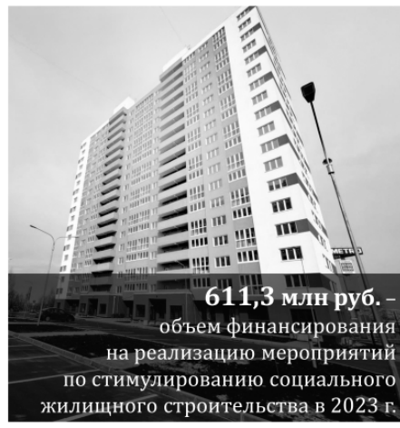
611,3 млн руб. — объём финансирования на реализацию мероприятий по стимулированию социального жилищного строительства в 2023 г.

38 ветеранов ВОВ, инвалидов и ветеранов боевых действий, инвалидов и семей, имеющих детей-инвалидов 25 молодых семей 11 многодетных семей