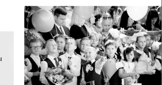
2023 год — Год педагога и наставника. Реализована насыщенная программа мероприятий. Среди важнейших направлений — повышение статуса учителя, рост профессионального мастерства орловских педагогов

На 450 мест построен дополнительный корпус МБОУ «Средняя общеобразовательная школа № 2 г. Ливны»