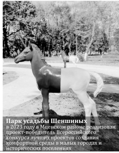
Парк усадьбы Шеншиных в 2023 году в Мценском районе реализован проектом-победителем Всероссийского конкурса лучших проектов создания комфортной городской среды в малых городах и исторических поселениях

9 проектов-победителей Всероссийского конкурса лучших проектов создания комфортной городской среды реализованы в 2023 году