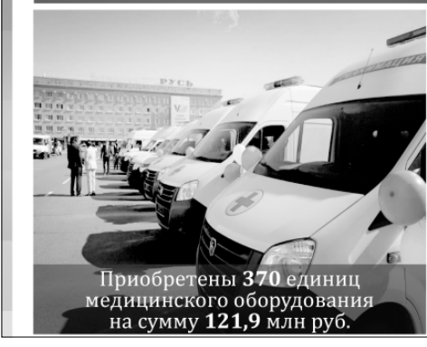
Приобретены 370 единиц медицинского оборудования на сумму 121,9 млн руб.

8,7 млрд руб. — объем финансирования на реализацию региональной программы «Развитие отрасли здравоохранения» 2023 год из них 1,16 млрд руб. (+ 7,2% к 2022 г.) выделено на льготное лекарственное обеспечение граждан