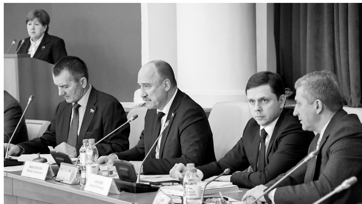
В конструктивном взаимодействии всех ветвей власти

Губернатор Орловской области и региональные омбудсмены отчитались о своей работе за 2023 год перед депутатами областного Совета