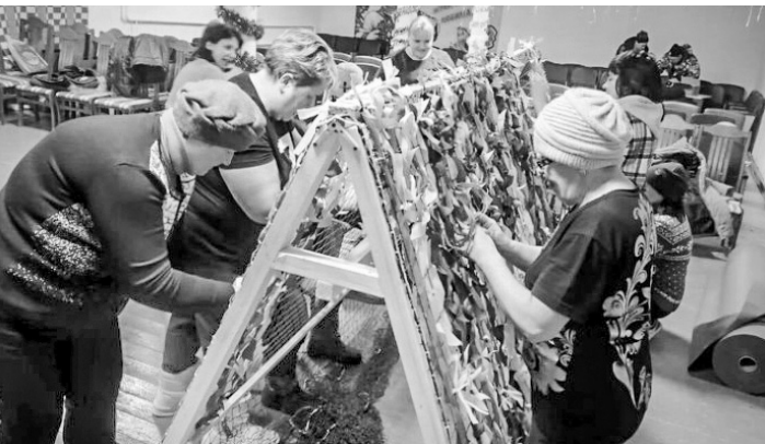
Свечи согреют бойцов