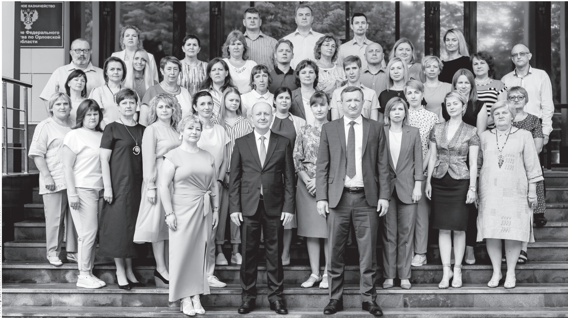
Коллектив Управления федерального казначейства по Орловской области

Управление Федерального казначейства по Орловской области 8 апреля отмечает 30-летие своего образования