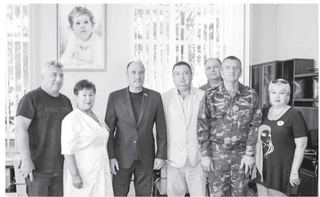
в сложное время. Большое спасибо всем, кто принял участие в сборе гуманитарного груза для наших детей!

— Сегодня больница обеспечена и медикаментами, и питанием, — сказала она. — Но, конечно же, очень приятны забота и внимание к нашему региону. Это показывает единство нашей страны, готовность прийти на помощь друг другу