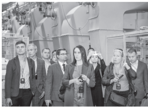
Гости из Петербурга посетили орловские предприятия

Было подписано соглашение о сотрудничестве между Санкт-Петербургским государственным бюджетным учреждением «Городское туристско-информационное бюро» и бюджетным учреждением культуры нашего региона «Туристский информационно-выставочный центр Орловской области». Кроме того, была организована биржа деловых