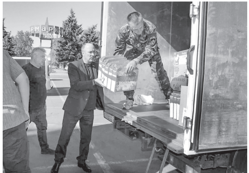
Тетради, портфели и орловские яблоки — луганской детворе

— Это уже не первый наш визит в медучреждения республики, — сказал секретарь Орловского регионального отделения «Единой России»,