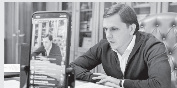
Главное из прямого эфира в социальных сетях губернатора Орловской области Андрея Клычкова за минувшую неделю.