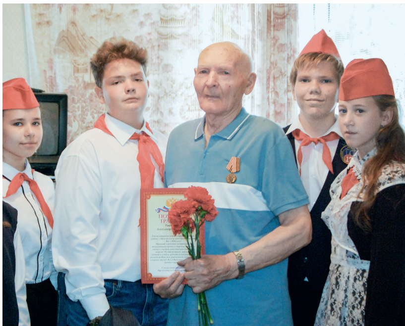
Пионеры в гостях у человека-легенды