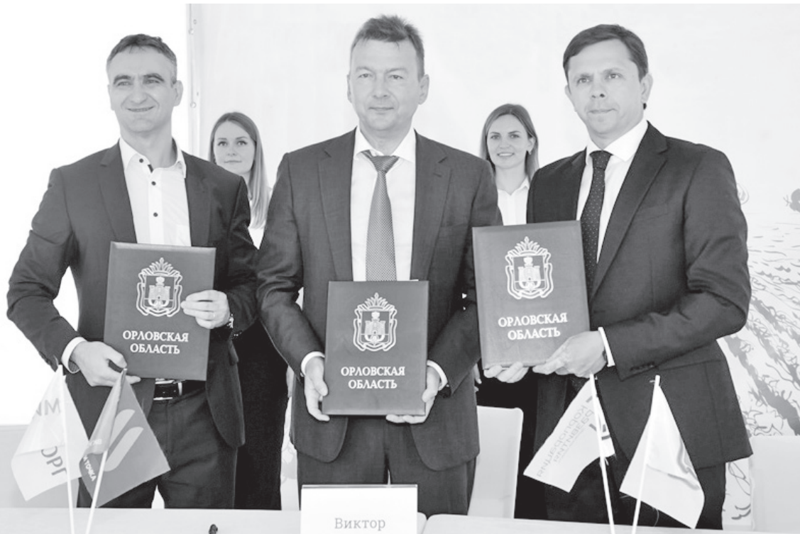
Соглашение — на перспективу

В строительство завода по глубокой переработке картофеля на территории особой экономической зоны «Орёл» будет инвестировано дополнительно 5,7 млрд. рублей.