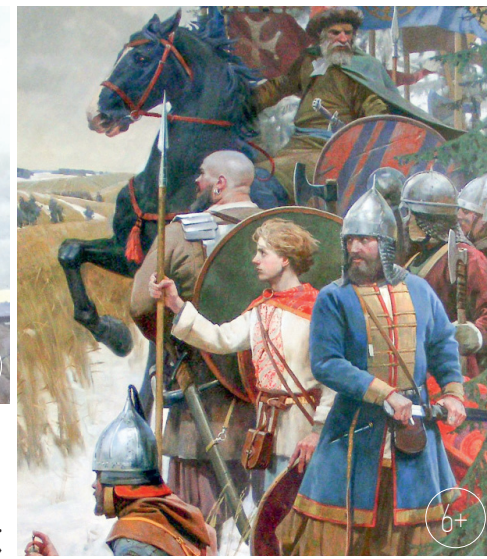
И. Лебедев. «Дружина»