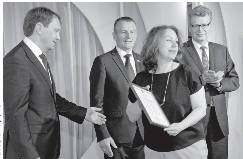
Заслуженные награды работникам «лёгкой» отрасли

В Орловском государственном университете им. И. С. Тургенева 7 июня прошло торжественное мероприятие, посвящённое Дню работников текстильной и лёгкой промышленности.