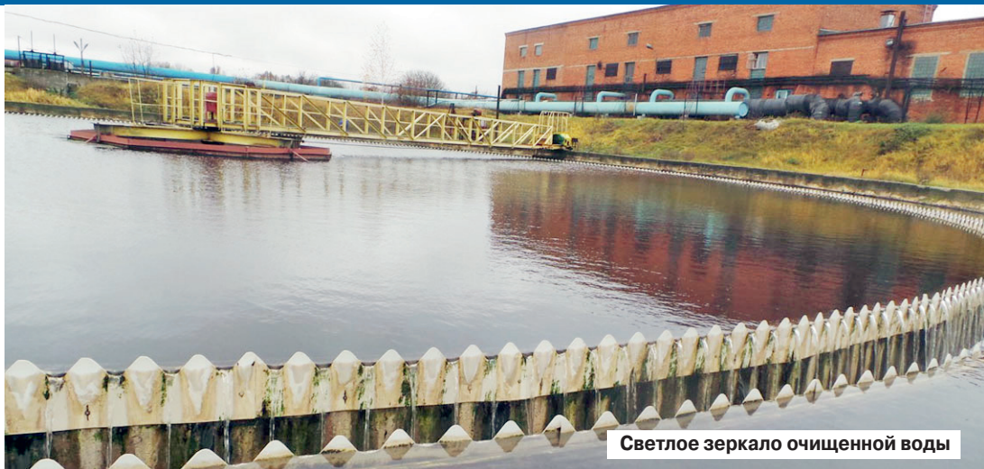
Светлое зеркало очищенной воды