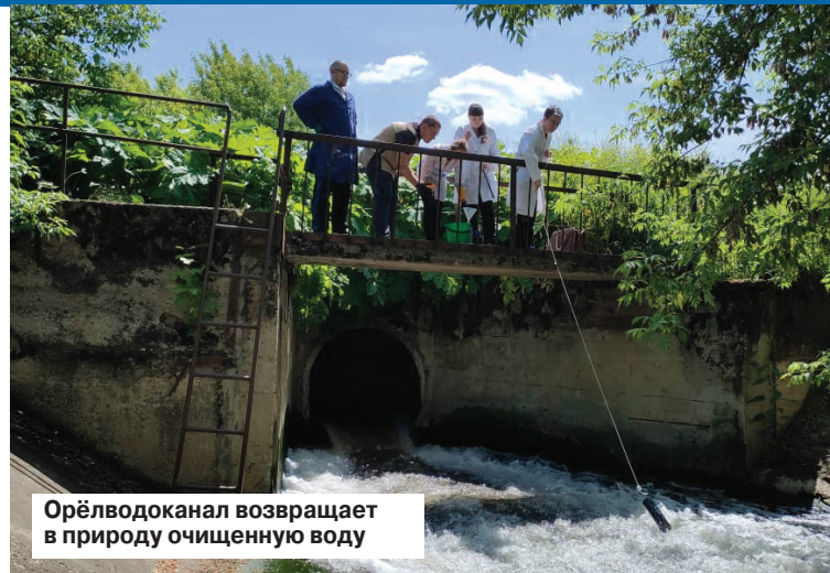
Орёлводоканал возвращает в природу очищенную воду