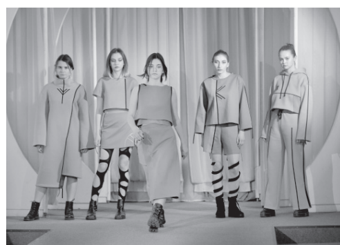
«Русский силуэт» с орловским акцентом

— В это сложное, неординарное время каждый из нас выбирает, по какому