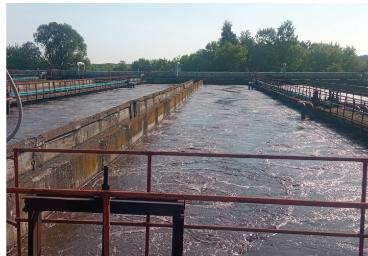
Обработка стоков в аэротенках — интенсифицированный процесс очистки с подачей кислорода