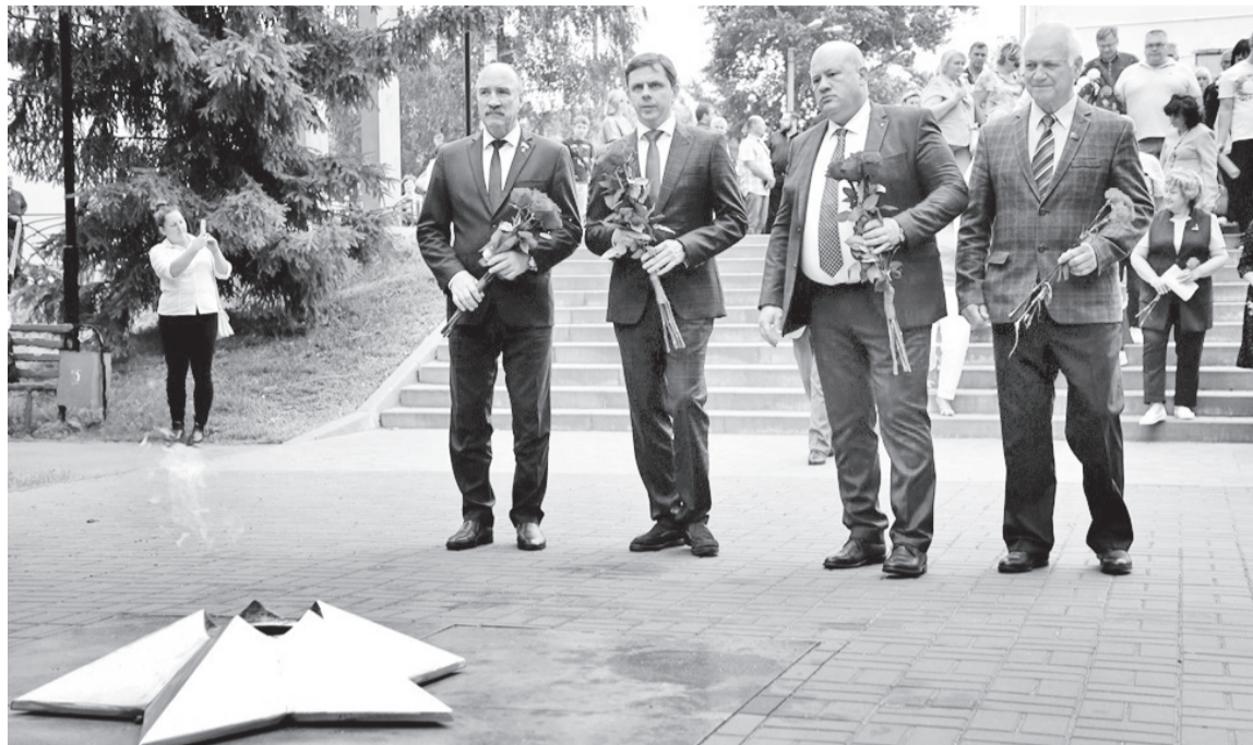
День памяти защитникам Отечества