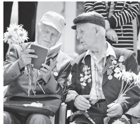
Не стареют душой ветераны