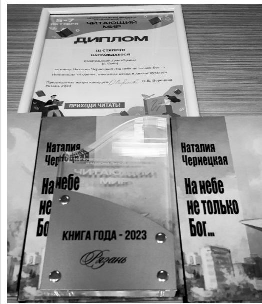
Книга, изданная в Орле, получила диплом «Читающий мир»