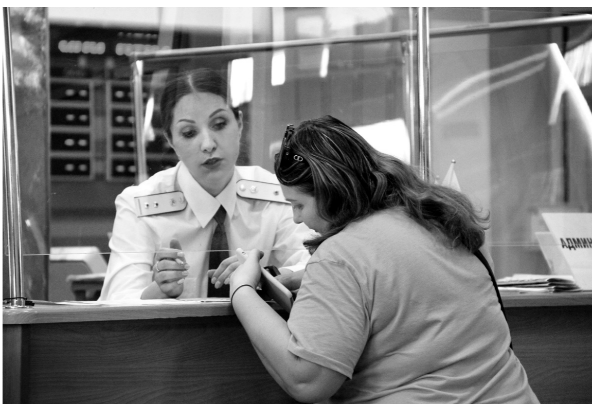
Налоговая служба постоянно развивается, ориентируясь на реалии времени и потребности людей

бюджет возросли по сравнению с соответствующим периодом 2022 года на 21,5 % (+1,9 млрд. руб.), в территориальный бюджет — на 11,6 %, или в абсолютном выражении плюс 3,3 млрд. рублей.