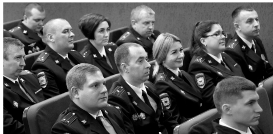
В профессиональный праздник поощрили лучших из лучших