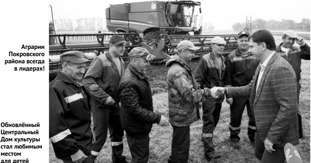
Аграрии Покровского района всегда в лидерах!

— Стоимость проекта превышает 200 миллионов рублей. Планируем реализовать его до 2025 года. Проект предусматривает обустройство площадки под строительство 142 домов, в том числе 20 — для работников АПК. В 2022 году объём финансирования проекта составил почти 40 миллионов рублей. В настоящее время проложены сети связи, наружные сети газоснабжения и построены сооружения водоснабжения. Объём финансирования в 2023 году составит 41,7 миллиона рублей. Средства будут направлены на строительство сетей водоснабжения, участка автодороги и устройства линий освещения улиц. — При поддержке областного бюджета и средств Дорожного фонда Орловской области