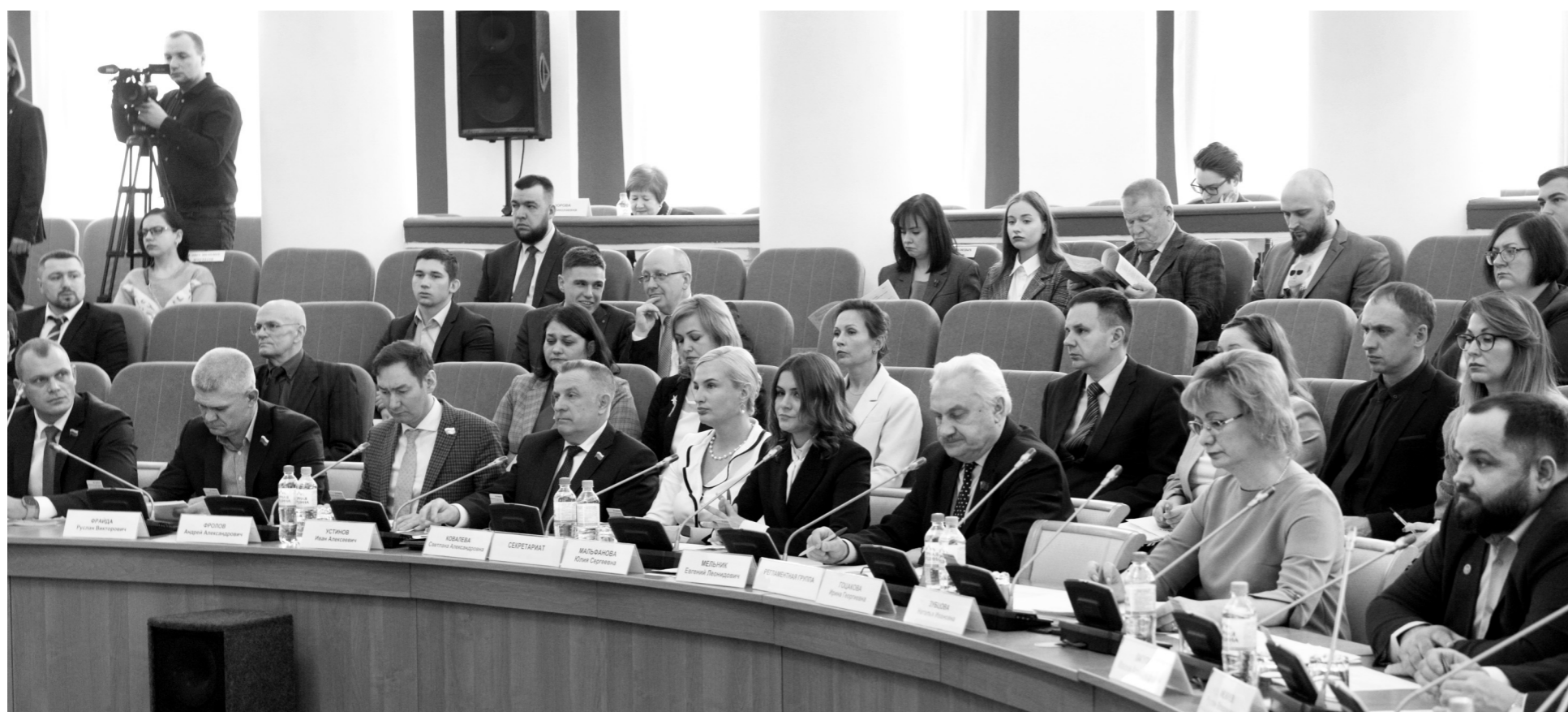
Депутаты областного Совета положительно оценили деятельность правительства Орловской области в непростом 2022 году