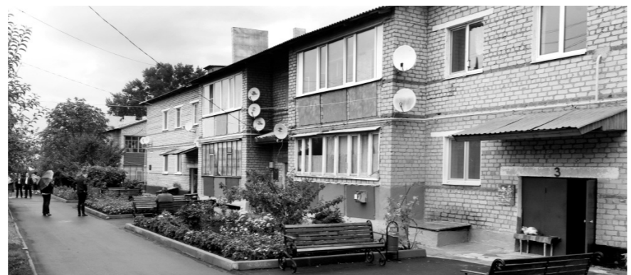
Благоустройство дворовых территорий идёт полным ходом