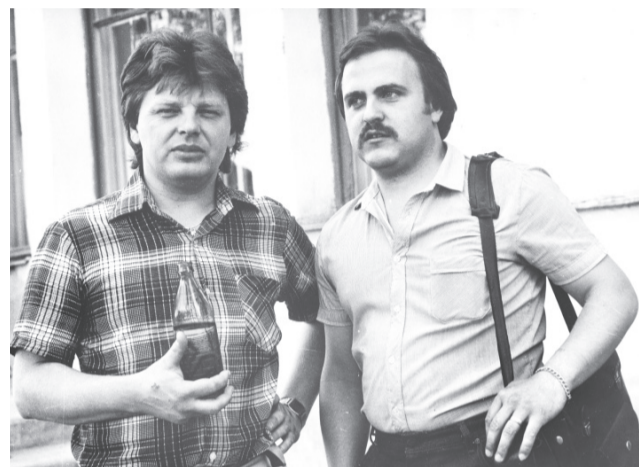
С композитором и певцом Юрием Антоновым