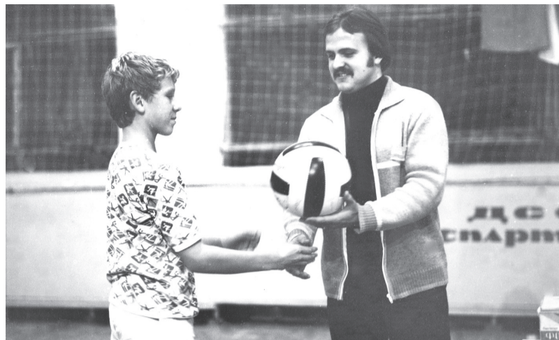
Приз лучшему бомбардиру детского футбольного турнира