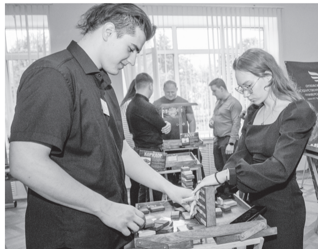
На выставке были организованы интересные мастер-классы

Студенческий фестиваль завершился награ-