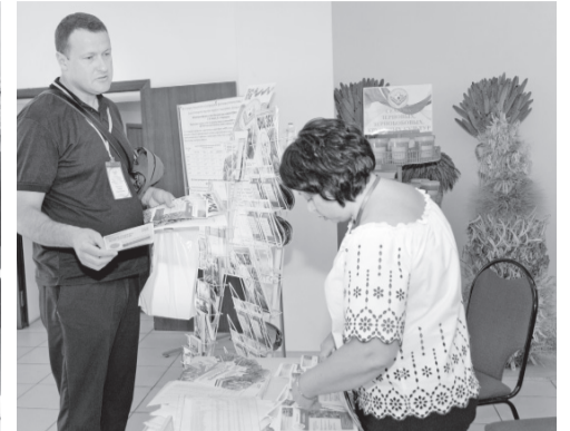
У одного из стендов конференции

Тема второй секции звучала так: «Цифровизация научного и производственного процес-