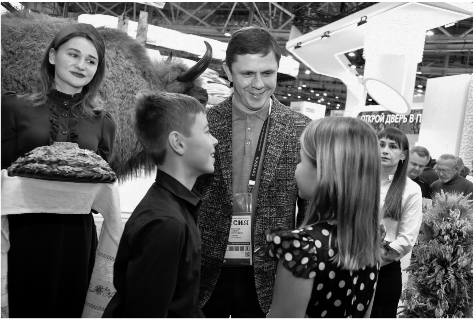
В орловском павильоне не скучно даже самым юным посетителям

*** 27 ноября экспозицию Орловской области посети-