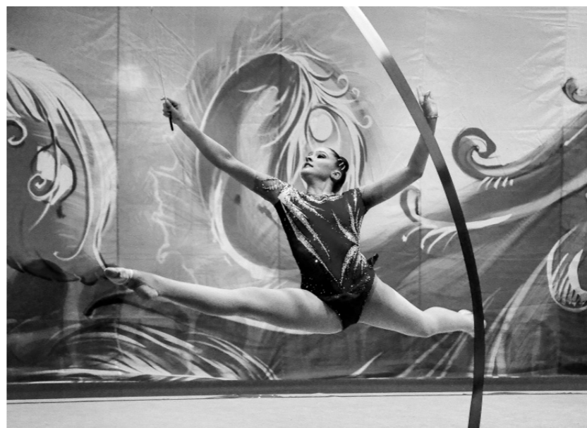
Художественная гимнастика — один из самых изящных видов спорта