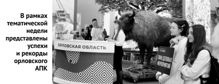
В рамках тематической недели представлены успехи и рекорды орловского АПК