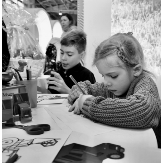
Познавательные игры дают возможность познакомиться с сельскохозяйственным производством

Добавим, что до конца голосования за достижения регионов остались считанные дни. 30 ноября проект ДОСТИЖЕНИЯ.РФ подведёт итоги. На общероссийском информационном ресурсе опубликовано более тысячи наиболее значимых успехов регионов в различных областях: науке, промышленности, образовании, здравоохранении и др. Орловцы ещё успеют поддержать родной регион. Проголосовать можно на сайте ДОСТИЖЕНИЯ.РФ, зайдя в Орловскую область на интерактивной карте России и выбрав наиболее значимые достижения.