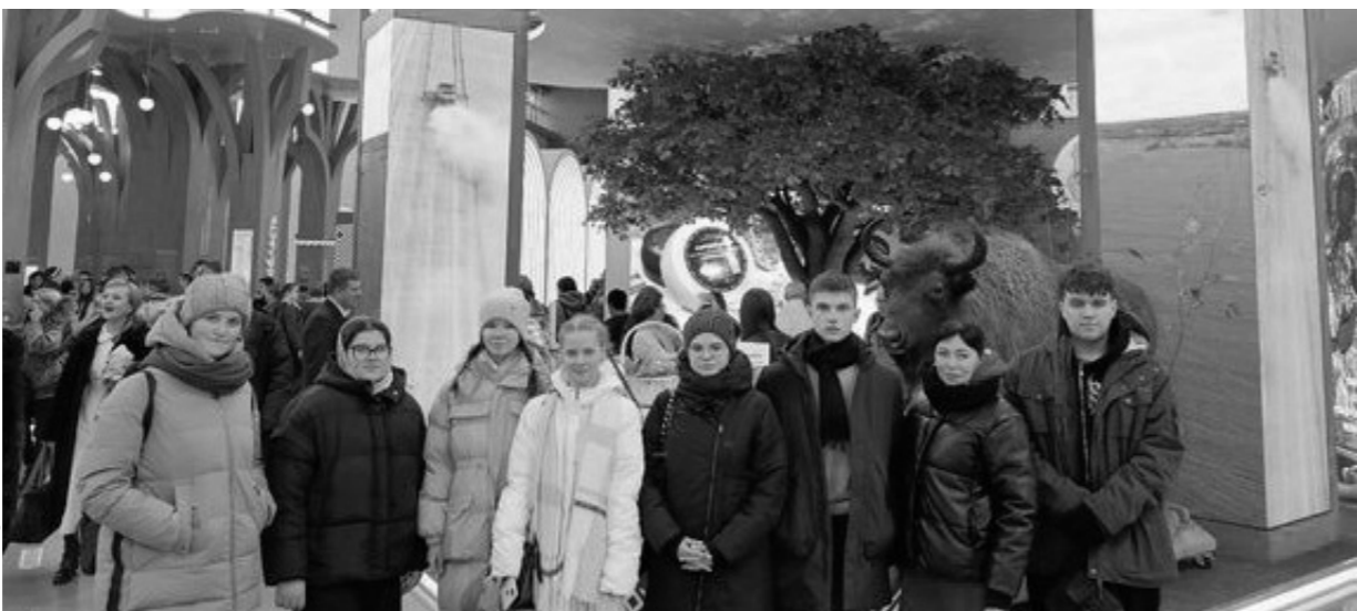
Знакомство с «Россией» началось с орловской экспозиции

Самое сильное впечатление на ребят произвёл павильон № 75, который так и называется «Россия». Здесь они смогли ознакомиться с выставками всех субъектов нашей страны. Познакомились с традициями, обычаями, культурой, достижениями каждого региона. Представлены там и новые регионы России.