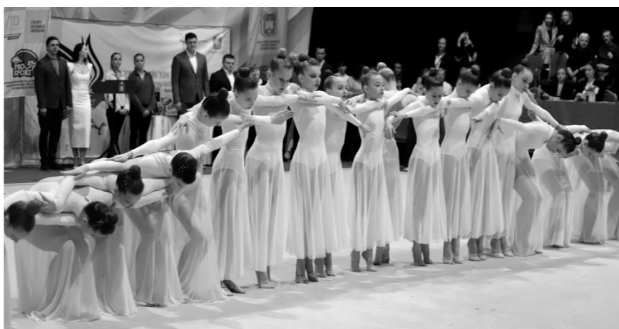
Представители 26 регионов России приехали в Орёл на соревнования

СПРАВКА Всероссийские соревнования по художественной гимнастике «Феникс» проводятся в Орле с 2021 года.