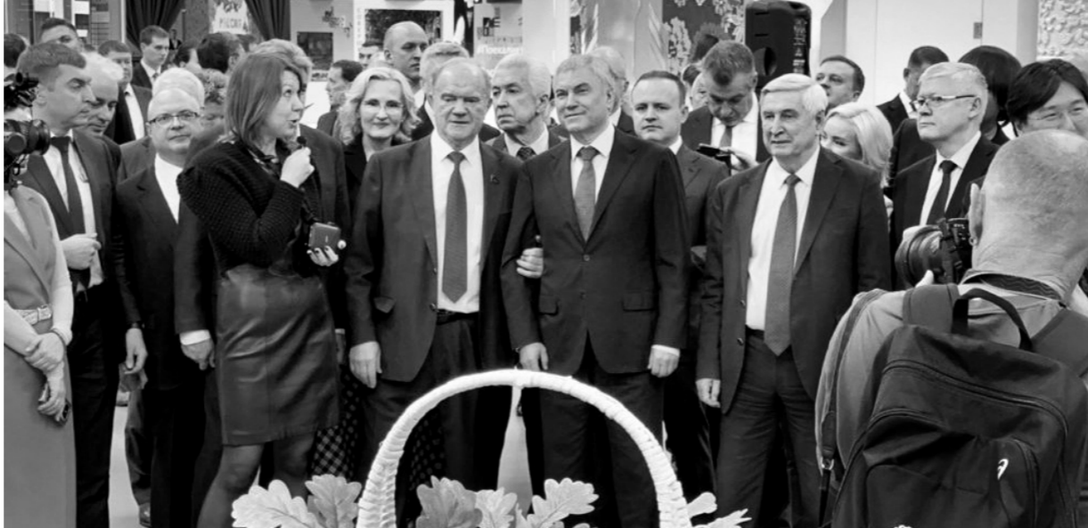
Депутаты Госдумы высоко оценили экспозицию Орловщины