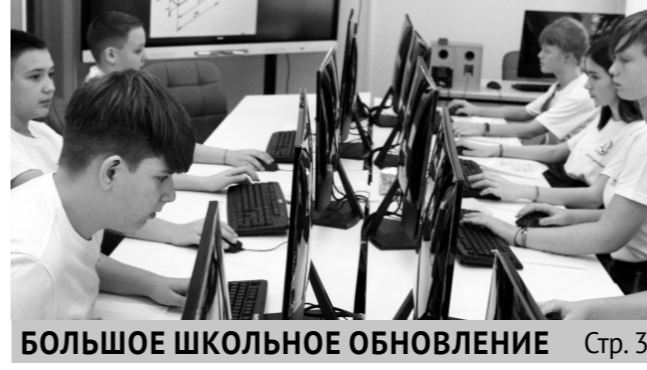
БОЛЬШОЕ ШКОЛЬНОЕ ОБНОВЛЕНИЕ Стр. 3