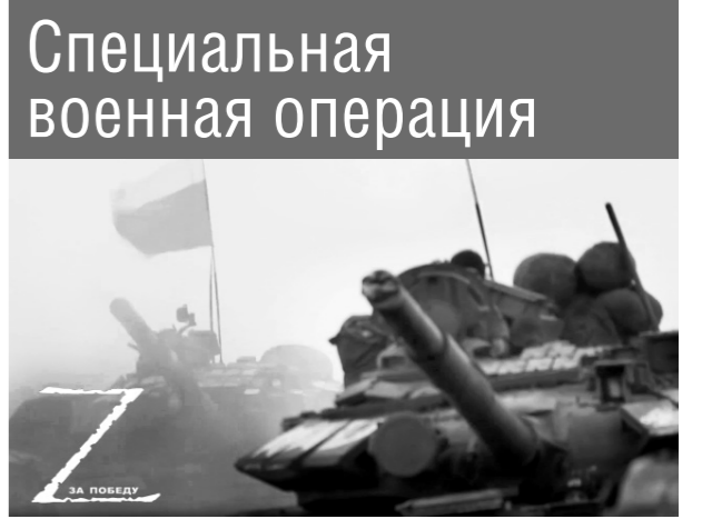
Специальная военная операция