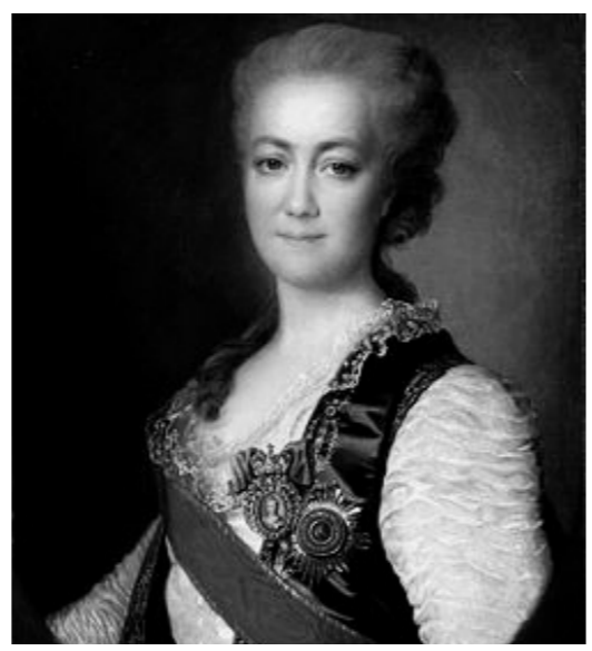
Дмитрий Левский. «Портрет княгини Екатерины Романовны Дашковой». 1784 г.

В наши дни в селе осталось 30 дворов, в которых, по данным на 2013 год, проживали 59 человек. А 12 из 21 поместья Екатерины Дашковой просто исчезли, не сохранившись даже в качестве пустошей.