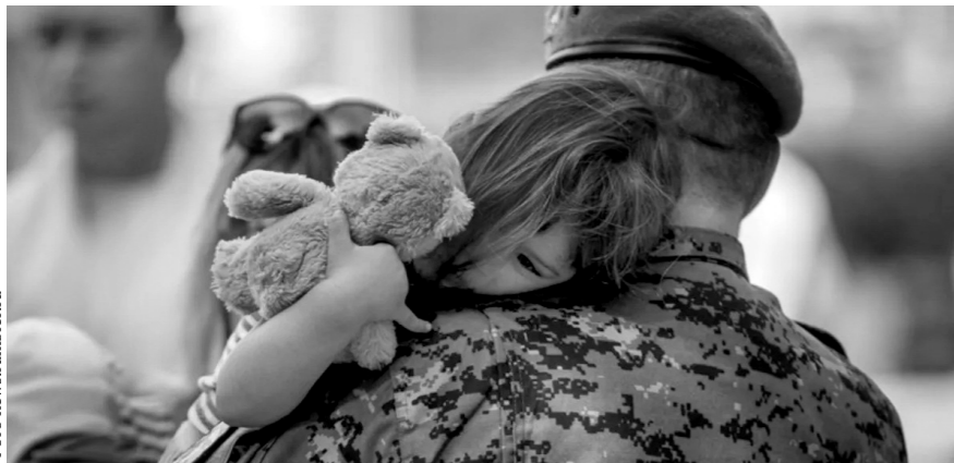
В зоне особого внимания — участники специальной военной операции

Орловская область — одна из первых в России, где создали социальные паспорта членов семьи участников специальной военной операции.