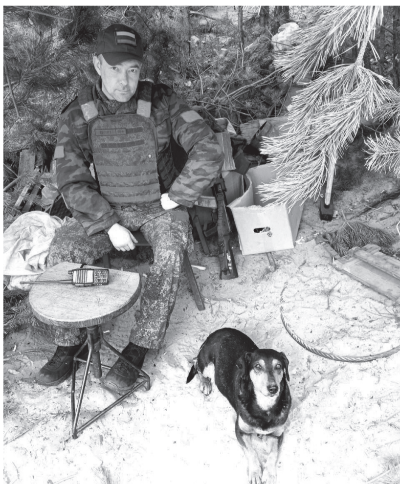
«Кто, если не мы?» — эта фраза стала девизом для Павла М., как и для многих других ребят, сражающихся за Россию