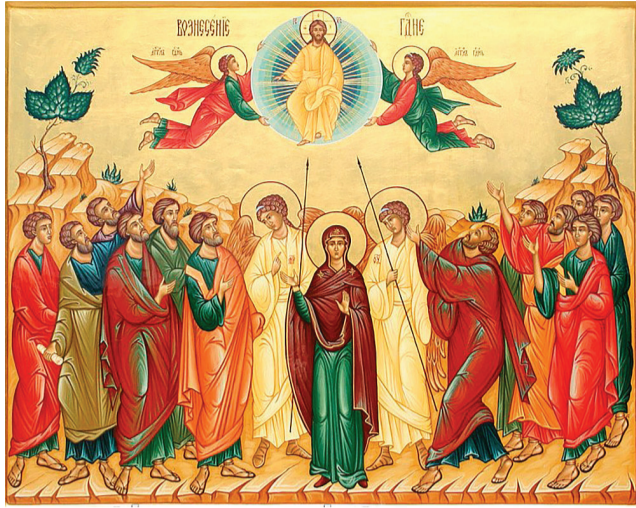
В этот день Господь вознёсся плотью на Небо и воссел одесную Отца

Мы должны радоваться, что наша человеческая природа так возвеличена и так возвышена Господом, что Он благоволил в Своем пречистом теле вознестись на небо, чтобы наше человеческое естество поставить выше херувимов и серафимов. Действительно, в тексте величания сегодняшнему празднику есть слова: «Величаем Тя, Живодавче Христе, и почитаем, еже на небеса с пречистой Твоею плотию преславное Вознесение». Итак, это значит, что Господь вознесся на небо со Своей плотью. Теперь Он наш Небесный Ходатай перед Отцом Своим (I, Ин. 2,1). Если бы Господь Иисус остался на земле, Он был бы в пределах только Палестины и Его благословения продолжали бы при-