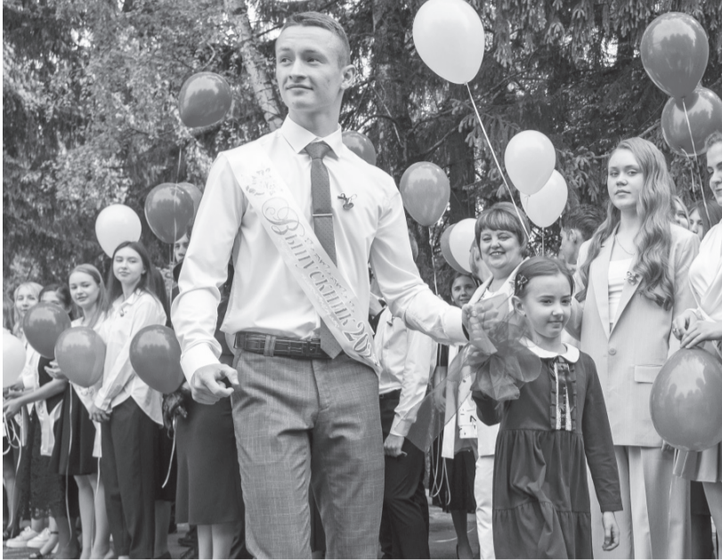
Школьного детства прощальный звонок

вас к успеху. Вы обязательно поступите в те учебные заведения, о которых мечтаете. Удачи вам и всего самого доброго!