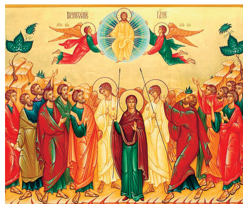
Своим благословением обнимает всю вселенную