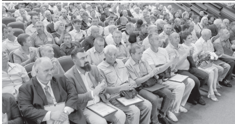
Строитель — больше, чем профессия