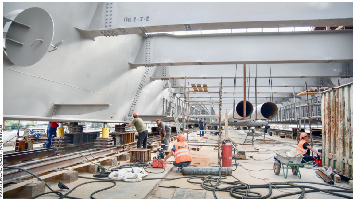
Сегодня работы на Красном мосту ведутся в усиленном режиме

круглосуточно, чтобы уже к 15 сентября, как и планировалось, залить плиту пролётного строения, соединив правый и левый берег.