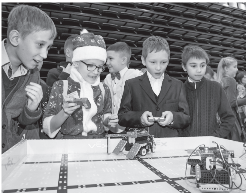
«Расскази, Снегурочка, где была...»