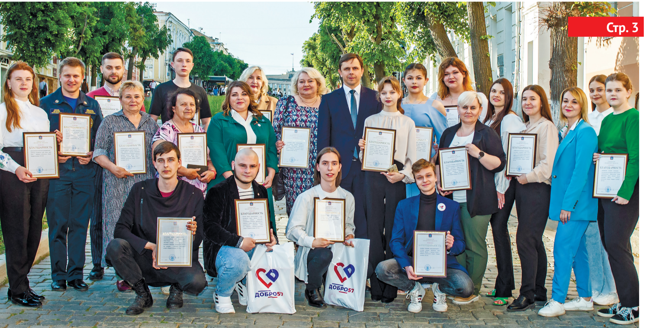
Губернатор Андрей Клычков 29 мая встретился в Молодёжном ресурсном центре Орла с победителями регионального конкурса «Портрет волонтера»