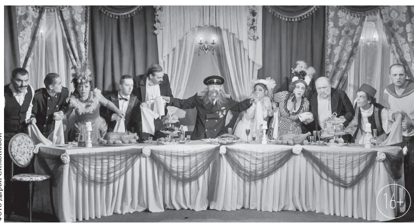
Свадьба с генералом по Чехову